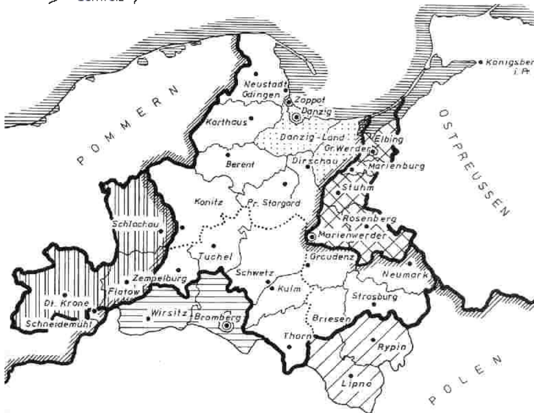
Karte der Provinz Westpreußen von 1878 – 1920