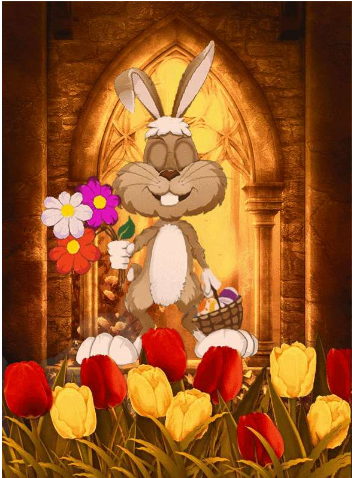
Im Original bewegt sich das „Tierchen!“