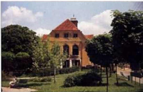
Das alte evangelische Gemeindehaus, vor etwa 40 Jahren war es noch vorhanden. Früher diente sein schöner großer Saal auch für Theateraufführungen und andere kulturelle Veranstaltungen.