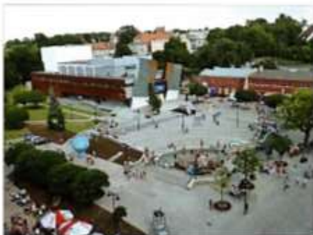
Heute befindet sich ein Kulturzentrum an der Stelle des alten Gemeindehauses. Es enthält auch einen z. B. als Kino nutzbaren Saal.