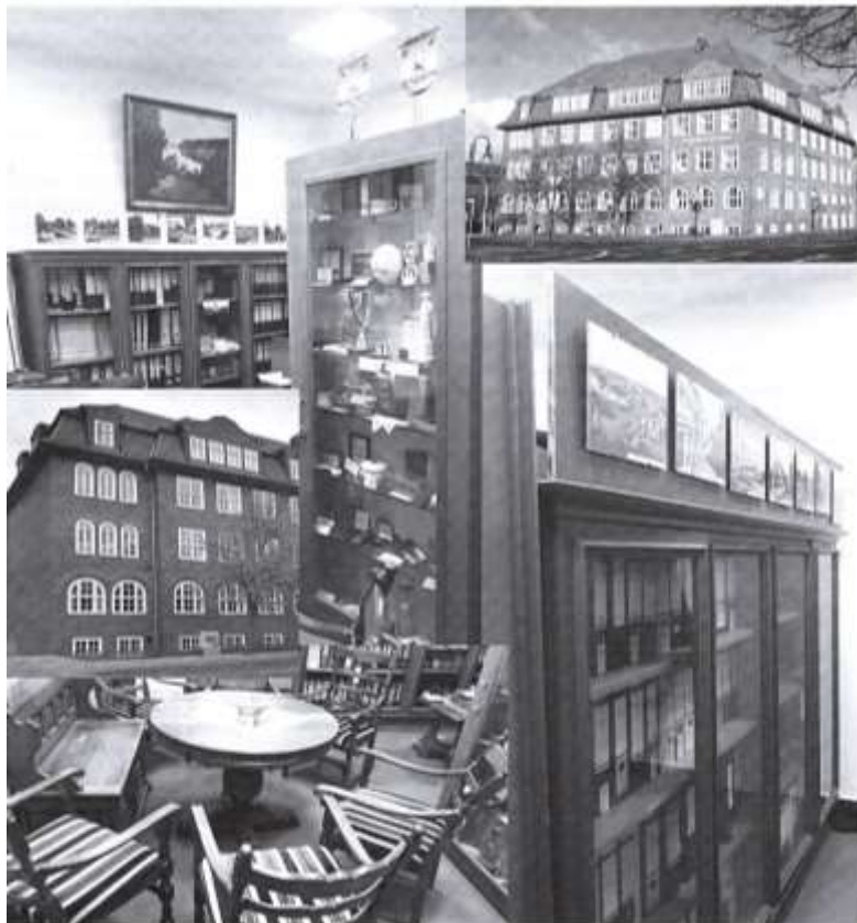
Die neue Heimatstube im bekannten Gebäude