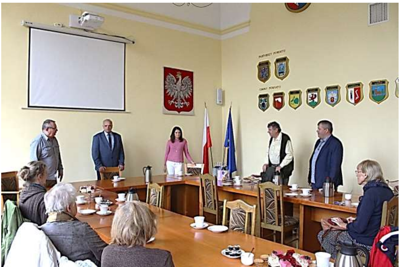
Empfang beim Landrat im Landratsamt