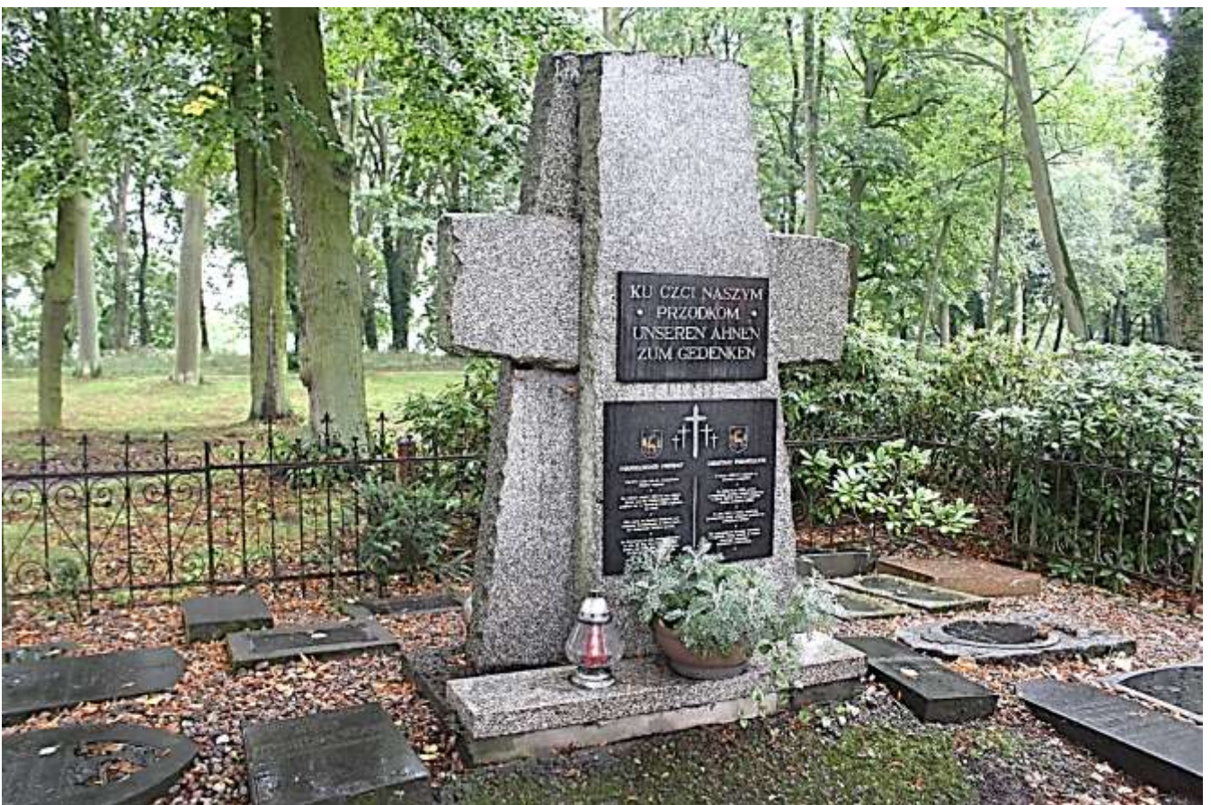
Gedenkstein auf dem ehem. Evangelischen Friedhof