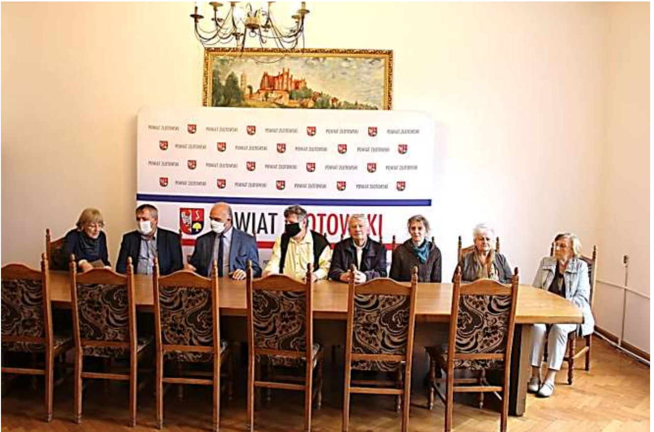
Unsere Gruppe mit dem Landrat und dem Übersetzer