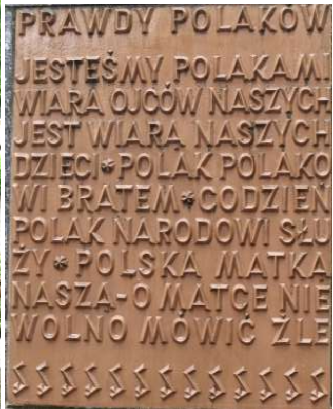
Gedenkstein: „Rückkehr zum polnischen Mutterland“ 1945