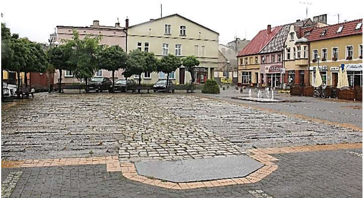
Im Pflaster des Platzes: hier stand die Synagoge!