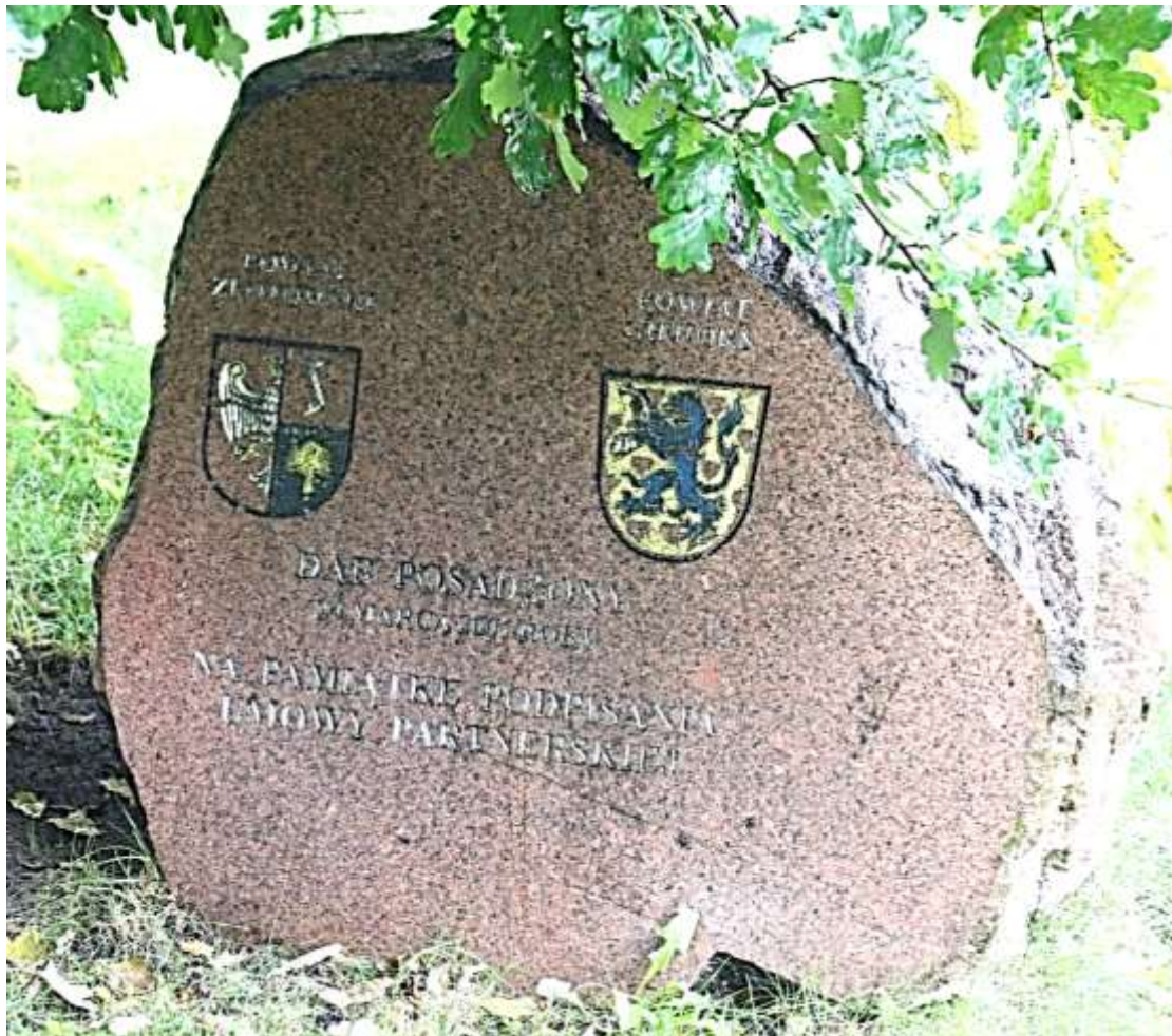
Gedenkstein für die Partnerschaft zwischen dem poln. Kreis Flatow und dem Kreis Gifhorn