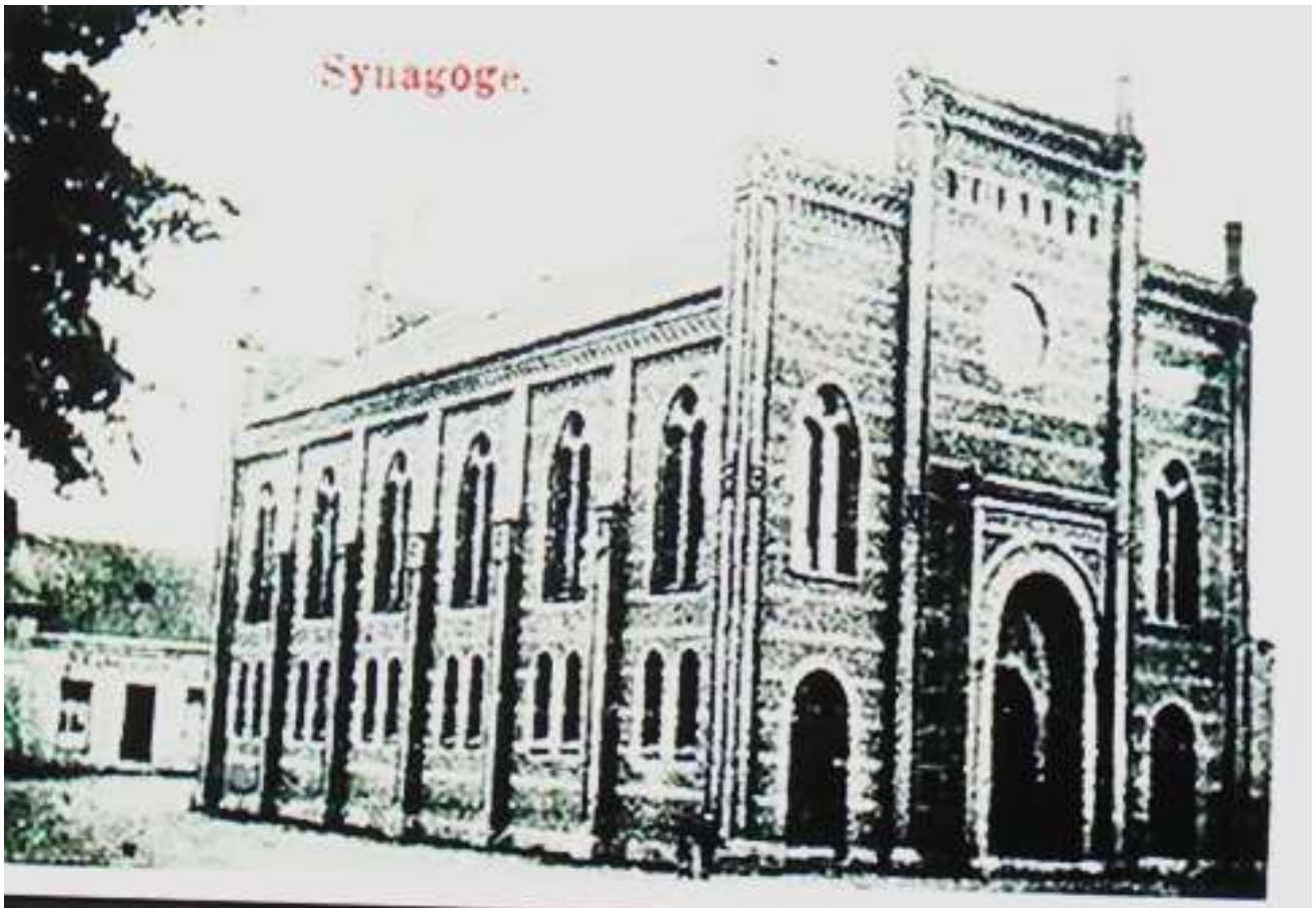
Die Flatower Synagoge in einer alten Ansicht

► 29. Weißenhöher Himmelfahrt 2020, 03. September 2020: Schloss Lubistron, Hopfengarten