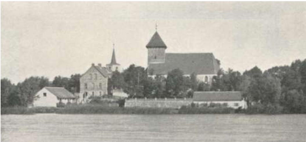
Katholische Kirche in Stuhm