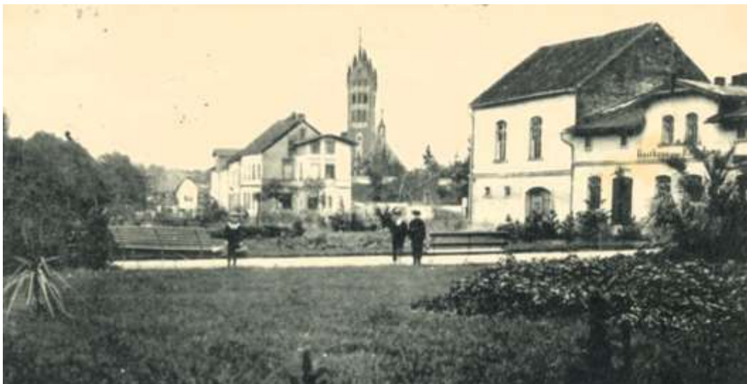
Riesenburg - Wilhelm-Platz und katholische Kirche

Der Pfarradministrator bemängelte das Fehlen einer angemessenen Kirche in Riesenburg. „Ein einziges einstöckiges und dazu baufälliges Haus ist alles, was wir besitzen. In diesem Hause ist auf der einen Seite unsere Kirche bestehend aus einem Zimmer; auf der andern Seite befindet sich meine Wohnung; in einer Giebelstube unsere Schule. Ein Schornstein im Hausflur ist zur Noth zu einer Sacristei eingerichtet.“ 13