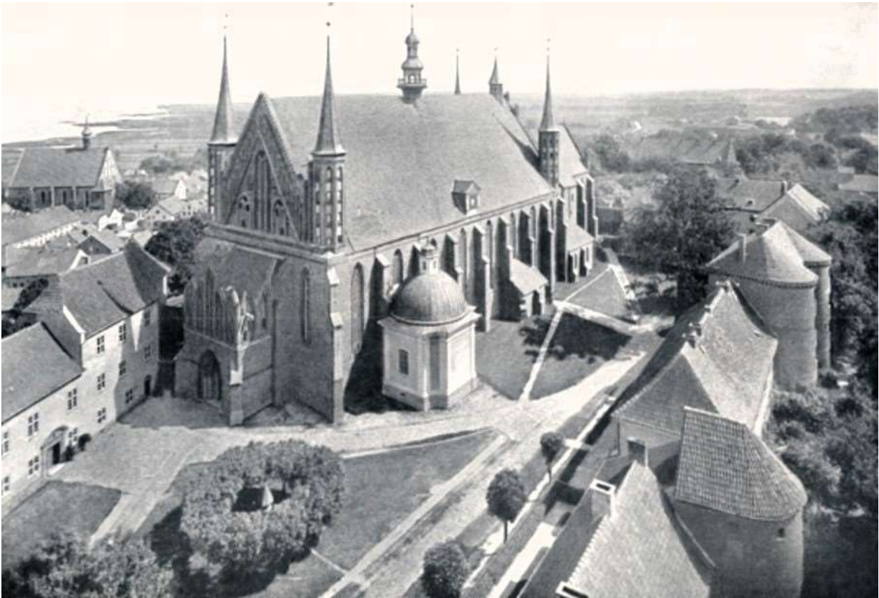
Dom in Frauenburg