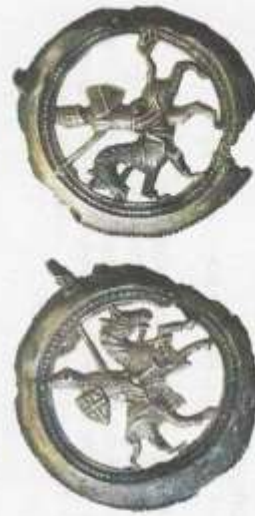
Knappspiegeldose, Ritter, 13./14. Archäologischer Fund, Stralsund, LARD MV