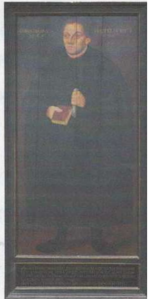
Porträt von Christian Ketelhut (um 1492–1546) von 1565 in St. Nikolai.

Wir bitten um Ihre verbindliche Teilnahme-Anmeldung bis zum 31.10.2025 an unseren Geschäftsführer, Email: bartels@pek.de