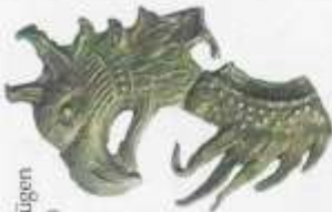
Greifenschalle, um 1300

Vor 700 Jahren wurde das Fürstentum Rügen in den pommerschen Herrschaftsbereich eingegliedert. Das Jubiläum ist Anlass sich dieser Landschaft, „dem umflossenen Land am Sund, den Landen Trilbees, Gönningen und Barth (Festlandrügen) samt Städten, Burgen, Menschen und anderem Zubehör“, besonders zu widmen. Nach dem Tod des letzten Rügenfürsten Wizlaw III. im Jahr 1325 geht das Lehnen vom dänischen König nicht unumstritten auf den pommerschen Herzog über. Zwei Erbfolgekriege (1326–1354) entbrannten zwischen den Nachbarn Mecklenburg, Dänemark und Pommern.