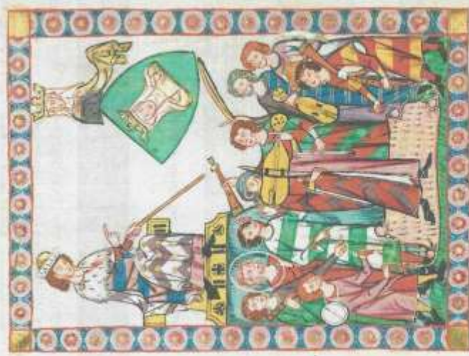
Altenberger Apokalypse aus der Fischelberger Liederhandschrift Codex Altesen wahre Bereich mit Darstellung Wlades III. mit Fürstentum an seinen Gewand.