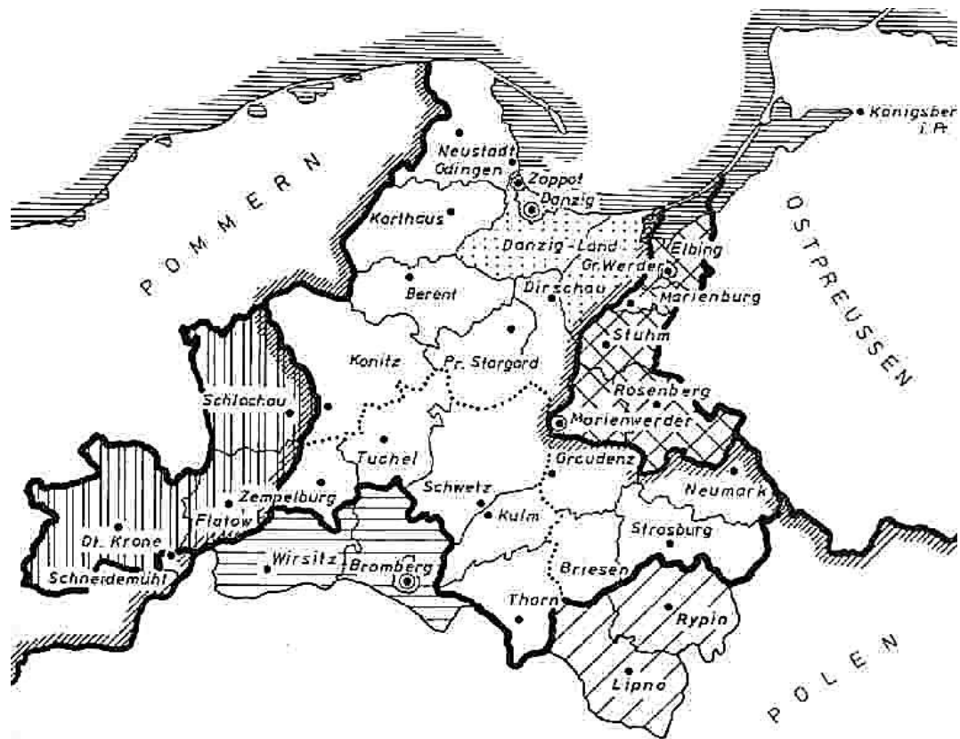
Karte der Provinz Westpreußen von 1878 – 1920