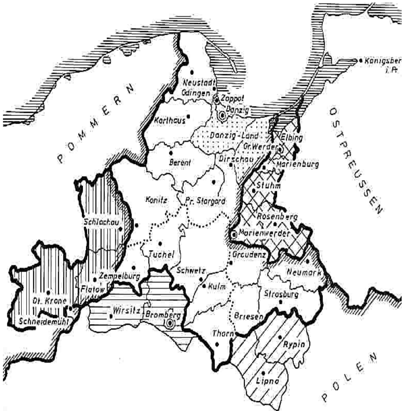
Karte der Provinz Westpreußen von 1878 – 1920