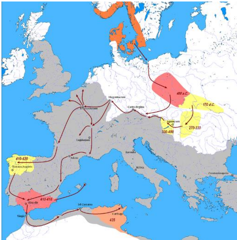
Mutmaßliche Wanderungen der Vandalen bis ca. 435 n. Chr. Eine Herkunft aus dem skandinavischen Raum entspricht jedoch nicht dem heutigen Forschungsstand.