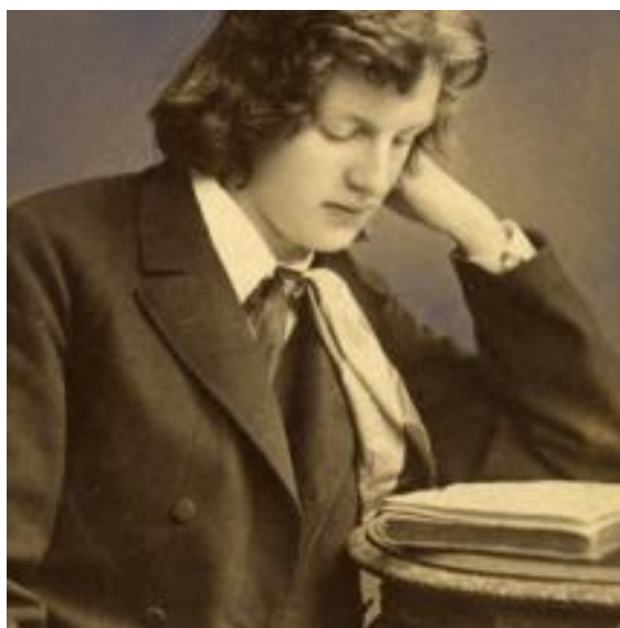
Gerhart Hauptmann 1885