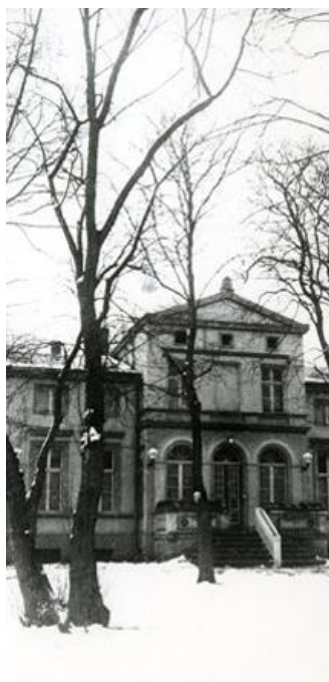
Die Villa Lassen um 1930