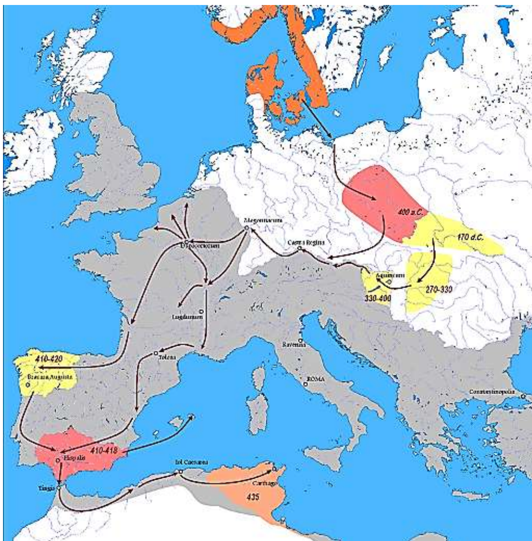
Mutmaßliche Wanderungen der Vandalen bis ca. 435 n. Chr. Eine Herkunft aus dem skandinavischen Raum entspricht jedoch nicht dem heutigen Forschungsstand.

www.westpreussen-berlin.de , westpreussenberlin@gmail.com