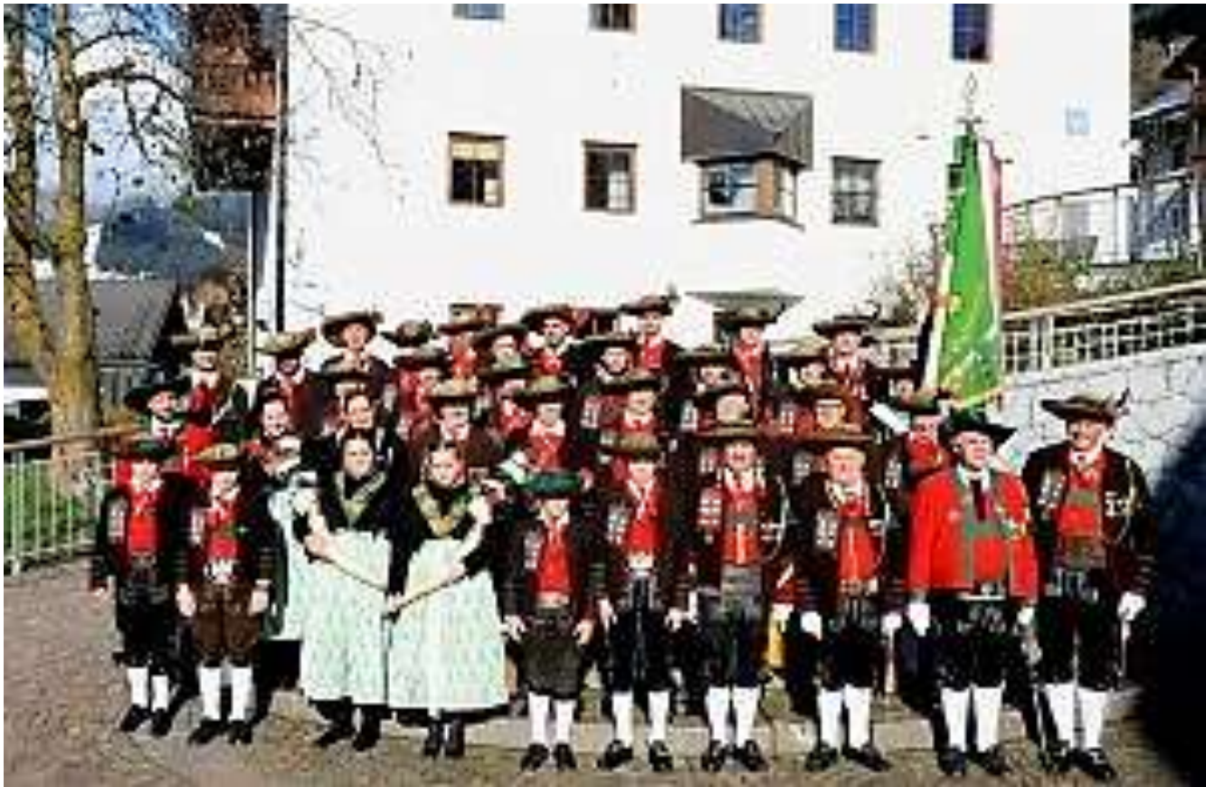
Die Mitglieder der Schützenkompanie Latzfons