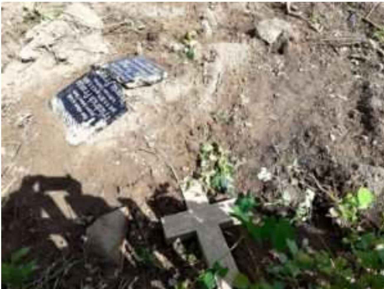
Der „hergerichtete“ evangelische Friedhof in Jannewitz bei Lauenburg

Polska ma problem z niemieckim dziedzictwem kulturowym. Wiadomo o tym nie od dziś. Wystarczy wybrać się na Dolny Śląsk i zobaczyć setki zrujnowanych pałaców czy sprawdzić, w jakim stanie są niemieckie cmentarze na północy kraju. Nie dziwi więc właściwie obecna ostatnio w mediach afera wokół stuletniego mostu w Pilchowicach, który miał zostać wysadzony na potrzeby filmu z Tomem Cruisem.