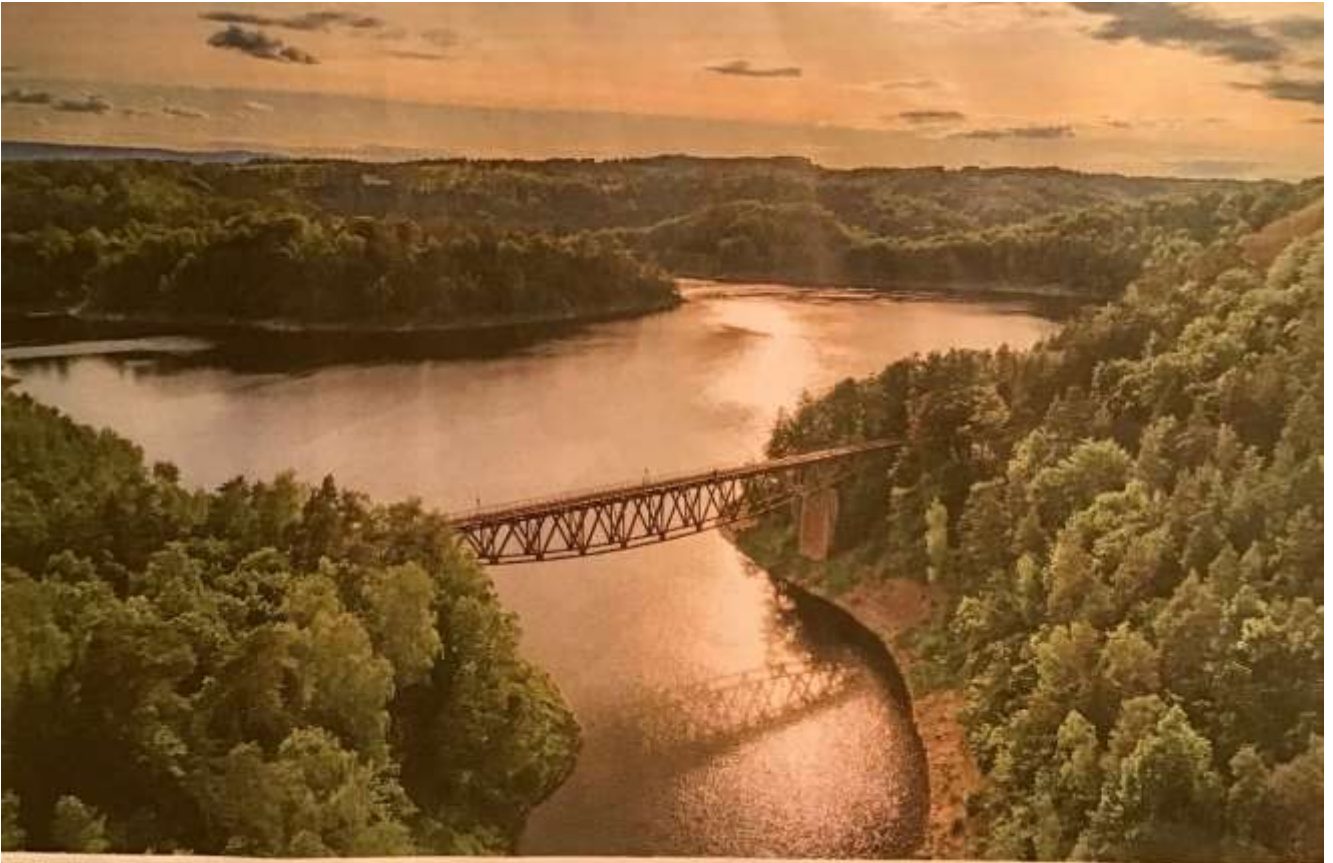
...ill ruht der See; Doch bald soll es hier ordentlich krachen, wenn die Brücke über die Bobertalsperre für den nächsten „Mission: Impossible“-Film gesprengt wird.