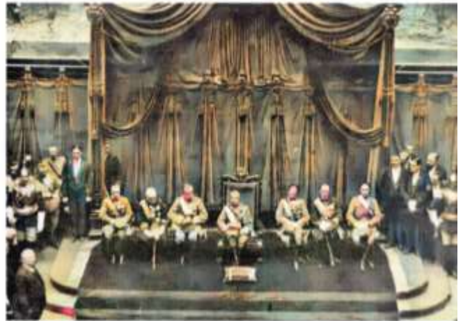
11. August 1930 - die Abgeordnetenkammer in Rom (hier bei der Angelobungsfeier) nimmt das von der Regierung vorbereitete Annexionsdekret mit 170 gegen 48 Stimmen an

Am 16. Juli 1930 trat der aufgezwungene Staatsvertrag nach Austausch der Ratifikationsurkunden in Kraft. Am 11. August 1930 nahm die Abgeordnetenkammer in Rom das von der Regierung vorbereitete Annexionsdekret mit 170 gegen 48 Stimmen an. Nur die Sozialisten hatten dagegen gestimmt und vergeblich eine Volksabstimmung in Südtirol gefordert. Am 24. September 1930 sollte dann auch der Senat das Annexionsdekret einstimmig annehmen und den Weg Südtirols in eine schlimme Knechtschaft öffnen.