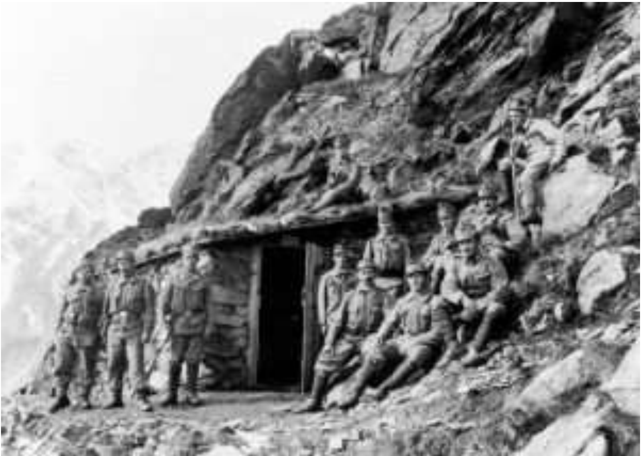
Die Standschützen – Angehörige der Schützenstände – verteidigten Tirol bis zum bitteren Ende.

Das Tiroler Schützenwesen blickt auf Jahrhunderte einer stolzen Tradition der Landesverteidigung zurück, die 1918 mit dem Zerfall der Monarchie und der Zerreißung des Landes Tirol tragisch endete.