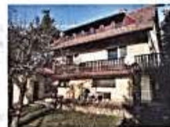
Gedenkstein in Flatow Landratsamt in Wirsitz Haus Anna-Charlotte