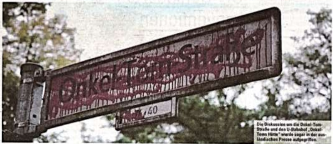
Die Diskussion um die Onkel-Tom-Straße und den U-Bahnhof „Onkel-Toms-Hütte“ wurde sogar in der ausländischen Presse aufgegriffen.

Auslöser solcher Diskussionen sind einzelne Personen, Gruppen, Parteien oder Organisationen, die auf Missstände aufmerksam machen wollen. Die Motive sind unterschiedlich und nicht immer klar definiert und erkennbar. Die FDP ist nicht generell