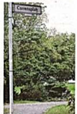
Der heutige Comensplatz war von 1936 bis 1938 nach dem ehemaligen Direktor des Kaiser-Wilhelm-Instituts für experimentelle Therapie, August von Wassermann (1866-1925), benannt.

Einzelne Aspekte dieses Beitrages veranlassten uns, an die Vorsitzende der FDP-Fraktion in der Bezirksverordnetenversammlung von Berlin Steglitz-Zehlendorf zu schreiben. Wir behalten uns vor, auf weitere in dem Beitrag genannte Aspekte zu einem späteren Zeitpunkt einzugehen.