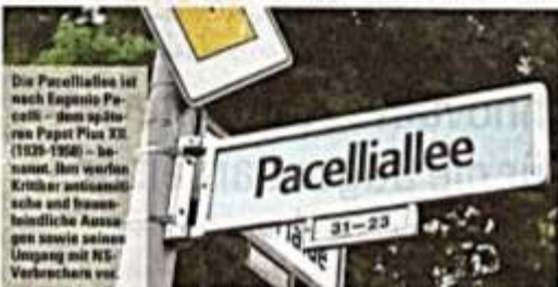
Die Pacelliallee ist nach Eugenio Pacelli – dem späteren Papst Pius XII. (1859-1963) – benannt. Ihn verurteilten Kritiker antisemitische und homophobische Aussagen sowie seinen Umgang mit NS-Verbrechern vor.