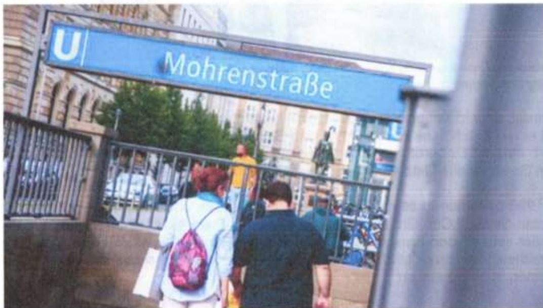
Berlins Mohrenstraße ist inzwischen nach dem schwarzen Philosophen Anton Wilhelm Amo umbenannt.