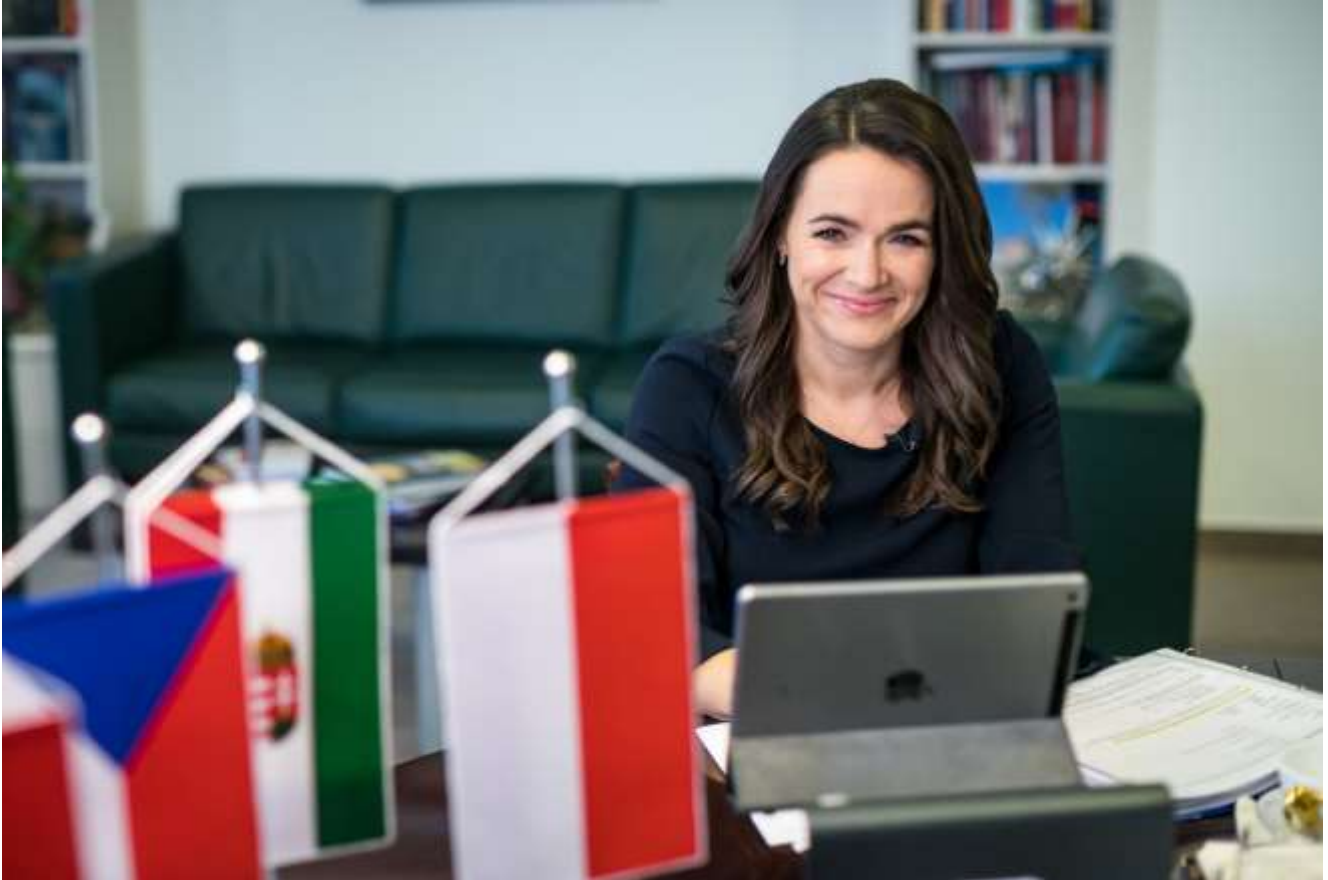
Katalin Novák · Bildquelle: Facebook

Zur Zeit hat der Fidesz den größten Handlungsspielraum und eine Unabhängigkeit, die mit Freiheit gleichbedeutend ist.