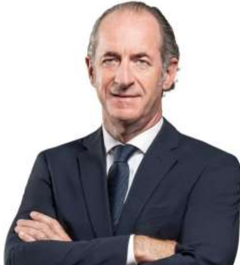
Luca Zaia

„Wir müssen uns bewusst sein [und] wissen, dass die Impfungen eine neue Weltordnung etablieren werden. Ob es uns gefällt oder nicht, das ist die Realität: Wir sollten versuchen, uns zu rüsten.“ Dies erklärte der Gouverneur von Venetien Luca Zaia gegenüber der italienischen Tageszeitung Corriere della sera .