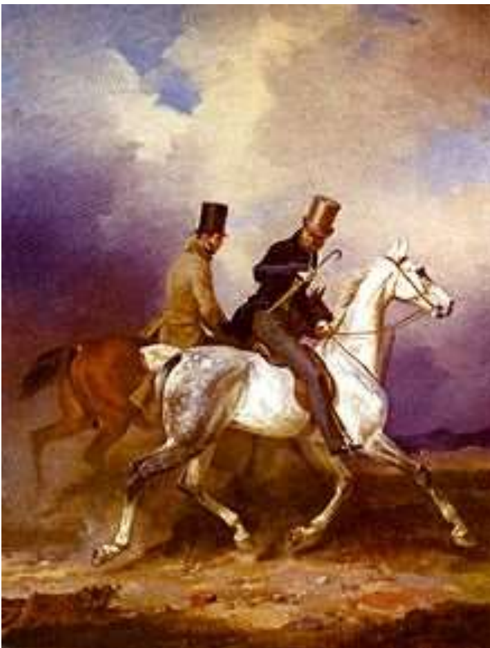
Ausritt des Prinzen Wilhelm von Preußen in Begleitung des Malers, Gemälde von Franz Krüger , 1836