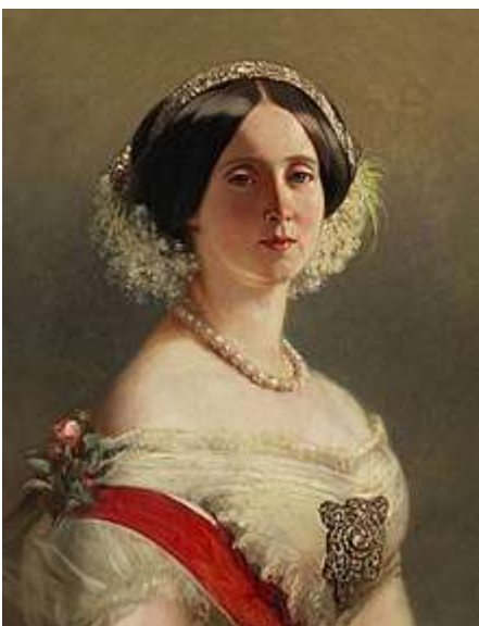
Augusta von Sachsen-Weimar-Eisenach