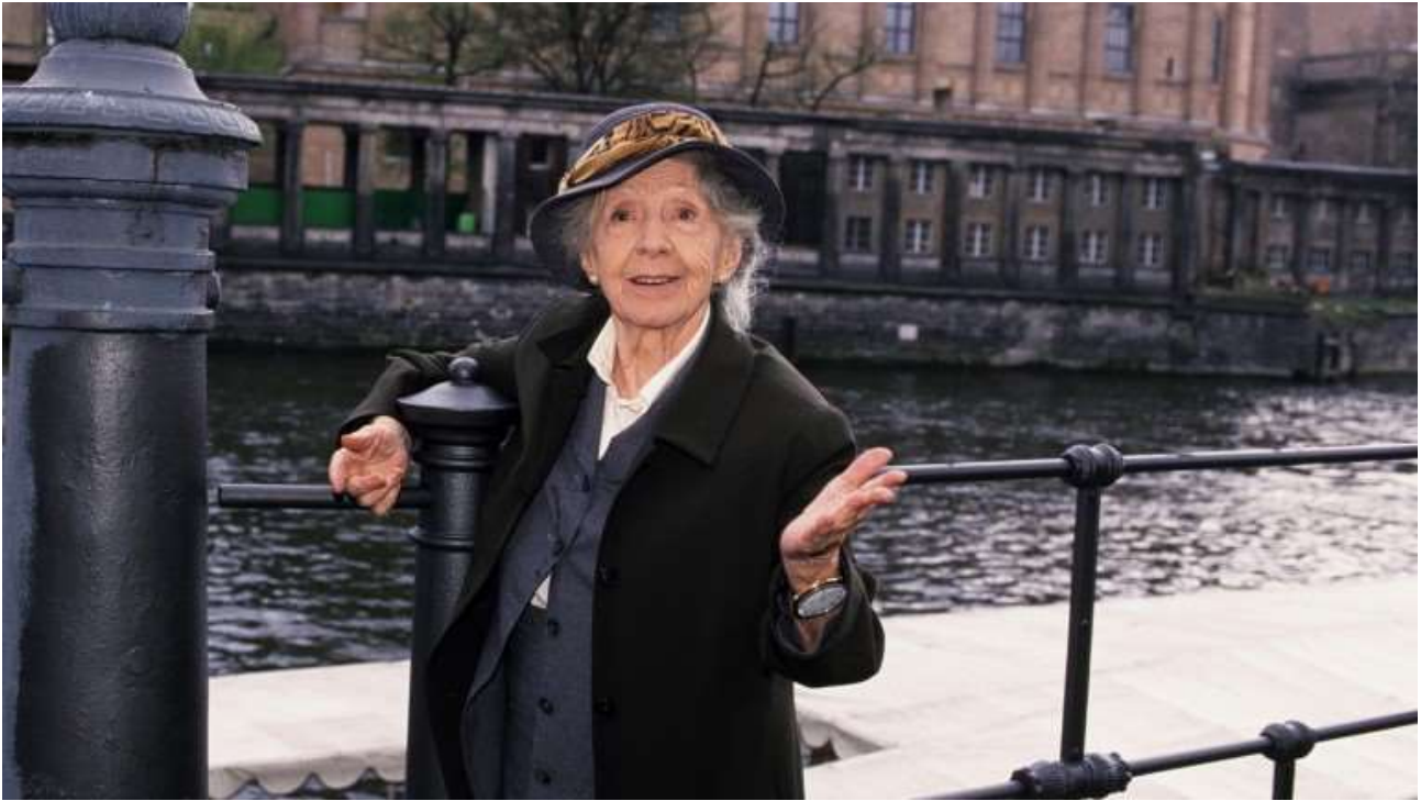
Inge Meysel in Berlin.