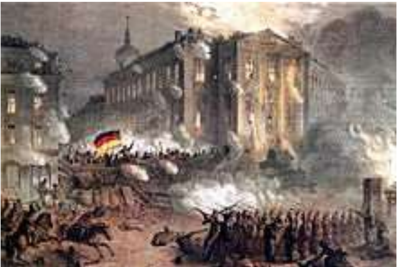
Märzrevolution 1848 in Berlin