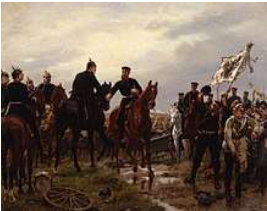
Nach der Schlacht bei Königgrätz, Gemälde von Emil Hünten , 1886