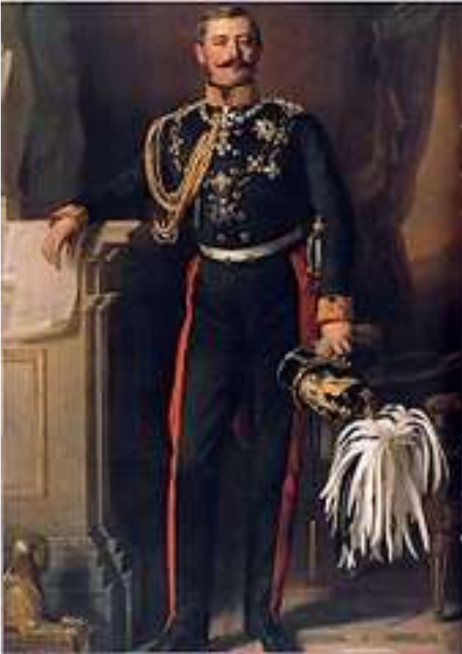
Karl Anton Fürst von Hohenzollern-Sigmaringen