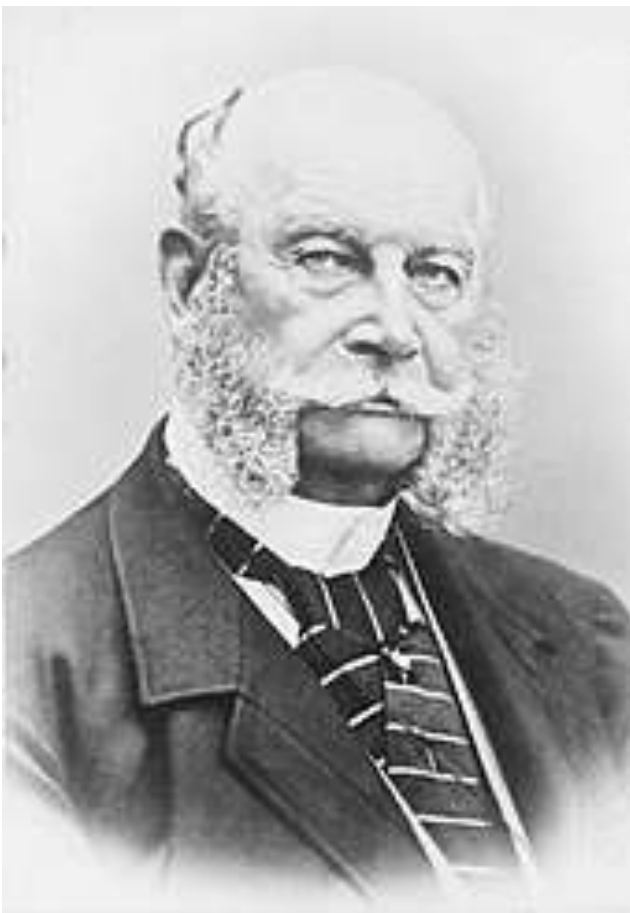
Wilhelm I. in Zivil, nach 1871

[Wird hier ausgespart! Vielleicht für später!]