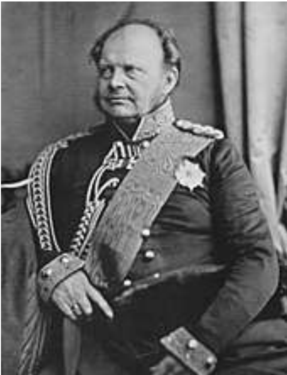
König Friedrich Wilhelm IV. , Bruder Wilhelms I.