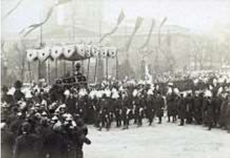
Trauerzug für Wilhelm I. im Berliner Lustgarten , 1888

Wilhelm, der im hohen Alter hohe Popularität genoss und für viele das alte Preußen verkörperte, starb nach kurzer Krankheit im Dreikaiserjahr am 9. März 1888 im Alten Palais Unter den Linden und wurde am 16. März im Mausoleum im Schlosspark Charlottenburg beigesetzt.