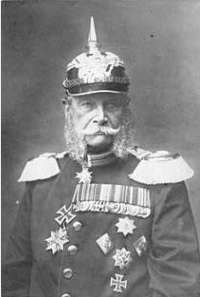
Wilhelm I. in Uniform mit Orden und Pickelhaube , 1884

Wilhelm akzeptierte aber letztlich, dass die Politik des neuen Deutschen Reiches von Bismarck bestimmt wurde. Das zeigen ihm zugeschriebene Aussprüche wie „Bismarck ist wichtiger“ oder: