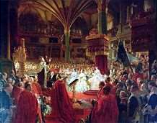
Krönung Wilhelms I. zum König in Königsberg, Gemälde von Adolph Menzel , 1861

Nach dem Tod seines Bruders Friedrich Wilhelm IV. am 2. Januar 1861 bestieg Wilhelm den preußischen Thron. Mit der von ihm selbst auf eigene Kosten veranstalteten Krönung meinte Wilhelm einen Kompromiss zwischen der nicht in der Verfassung vorgesehenen, aber von ihm gewünschten Erb huldigung , und der dort vorgeschriebenen Eidesleistung im Parlament gefunden zu haben. [10] Im Aufruf an mein Volk vom 8. Januar 1861 bekräftigte er seine Treue zum Eid auf die Verfassung, den er bereits 1858 als Prinzregent abgelegt hatte. Am 18. Oktober 1861 fand die prachtvolle Krönungsversammlung in Königsberg in der Schlosskirche statt.