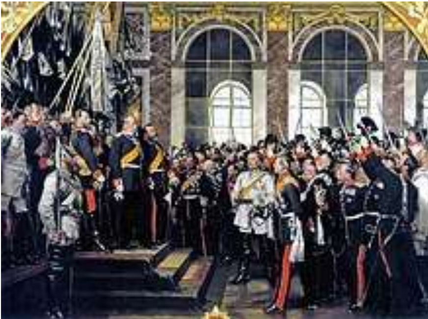
Proklamierung des Deutschen Kaiserreiches, Gemälde von Anton von Werner , 1885

Durch die Kaiserproklamation , die am 18. Januar 1871, dem 170. Jahrestag der Königskrönung Friedrichs III. von Brandenburg , im Spiegelsaal des Schlosses von Versailles stattfand, nahm Wilhelm für sich und seine Nachfolger zur Krone Preußens den Titel eines Deutschen Kaisers an und versprach, „allzeit Mehrer des Deutschen Reichs zu sein, nicht an kriegerischen Eroberungen, sondern an den Gütern und Gaben des Friedens auf dem Gebiet nationaler Wohlfahrt, Freiheit und Gesittung“. Der Proklamation war ein erbitterter Streit über den Titel zwischen Bismarck und König Wilhelm vorausgegangen. Wilhelm fürchtete, dass die deutsche Kaiserkrone die preußische Königskrone überschatten würde. Am Vorabend der Proklamation meinte er: