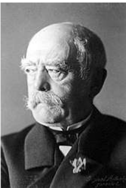
Otto von Bismarck