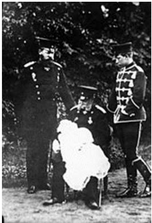
Kaiser Wilhelm I. mit Sohn, Enkel und Urenkel, 1882