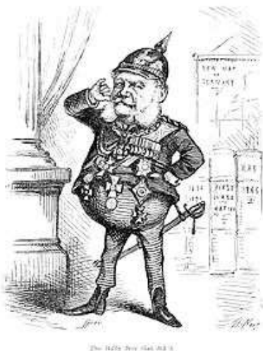
Karikatur Wilhelms I. von Thomas Nast