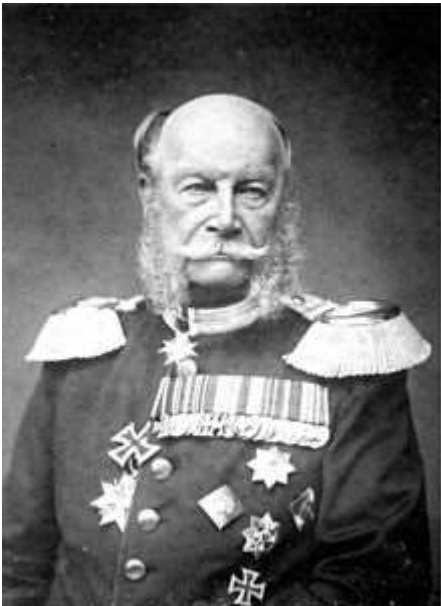
Wilhelm I. auf einem Porträt des Hoffotografen Wilhelm Kuntzemüller (1884)