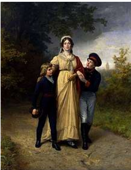
Königin Luise mit Prinz Wilhelm (links) und Kronprinz Friedrich Wilhelm (rechts), Gemälde von Carl Steffek , 1886