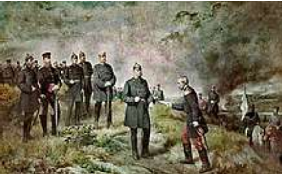
Nach der Schlacht bei Sedan, Gemälde von Carl Steffek , 1884

Die erste Gelegenheit zu Erfolgen in der Deutschlandpolitik bot der Deutsch-Dänische Krieg von 1864, in dem Preußen und Österreich gemeinsam als Wahrer deutscher Interessen in den mit Dänemark verbundenen Herzogtümern Schleswig und Holstein auftraten. Wie von Bismarck kalkuliert, kam es nach dem Sieg über die weitere Behandlung Schleswig-Holsteins zum Konflikt mit Österreich, mit dem Preußen damals noch immer um die Führung im Deutschen Bund konkurrierte. Der König erhielt das Siegestelegramm von der Schlacht bei Düppel auf der Rückfahrt von einer Truppeninspektion auf dem Tempelhofer Feld . Augenblicklich kehrte er um, um den Soldaten die Siegesbotschaft zu verkünden. Im Anschluss fuhr er zum Kriegsschauplatz, wo er am 21. April 1864, bei einer Parade auf einer Koppel zwischen Gravenstein und Atzbüll , den „Düppelstürmern“ persönlich dankte. [12]