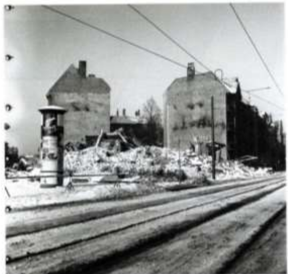
Trümmer auf dem Gelände der Thorwaldsenstraße 1-2, 10. Januar 1954

Gefördert durch die Senatsverwaltung für Kultur und Europa