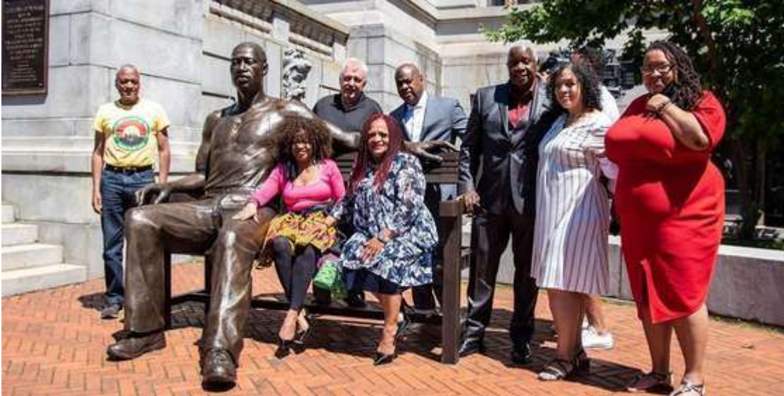
George Floyd-Statue in Newark, New Jersey

Joe Biden unterzeichnete kürzlich ein Gesetz namens Juneteenth , das den 19. Juni, den Tag, an dem die Sklaverei endete, zum Feiertag erklärt.