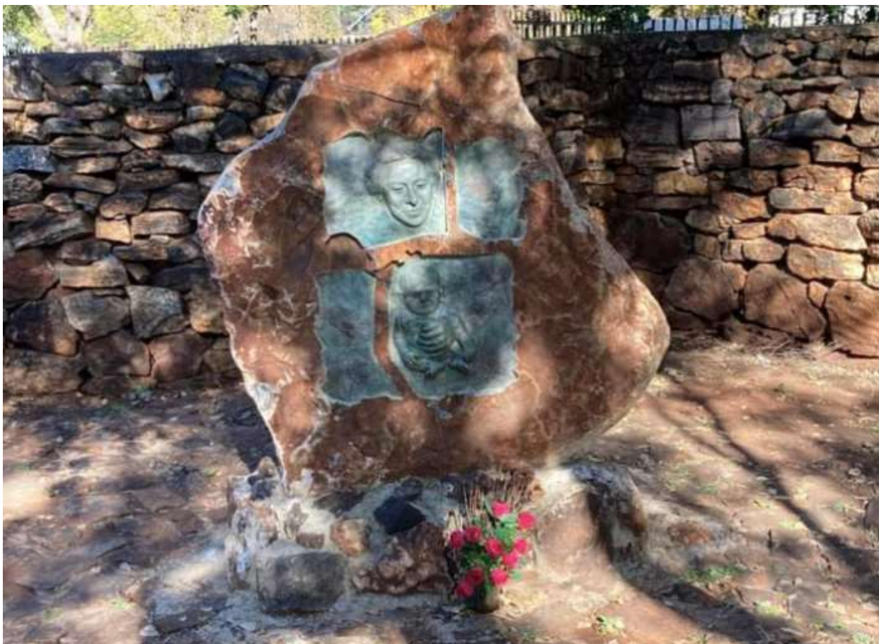
Denkmal für die Opfer des ersten Konzentrationslagers

Als ich mit Dutzenden von Einheimischen über die Situation dort sprach, gaben sie alle zu, dass sie in ständiger Angst leben, weil sie nie wissen, was der morgige Tag bringen wird: ob ihre Farm angegriffen wird oder nicht und ob sie kurzfristig überhaupt noch eine Farm haben werden. Einen Einblick in die lokale Situation erhalten Sie oft, wenn Sie mit Taxifahrern sprechen. Ich habe die Verantwortlichen von Uber, die ausschließlich schwarz sind, wiederholt gefragt, wie die Situation ist. Sie antworteten, dass es schrecklich sei. Mir wurde beigebracht, dass ich an manche Orte nicht gehen sollte, wenn ich überleben oder bestenfalls nicht entführt werden wollte. Als ich sie nach dem Grund fragte, antwortete ein großer Fahrer pauschal, dass „unsere Brüder faul sind“. Das gilt natürlich nicht für alle, aber für viele. Diese ganze Situation hat immer mehr Weiße dazu veranlasst, das Land zu verlassen und nach Neuseeland, Australien, in die Vereinigten Staaten oder nach Kanada zu ziehen. Außerdem traut sich kein vernünftiger Mensch, in dem Land zu investieren, was dem Tourismus zunehmend schadet. Warum an einem Ort investieren, an dem bald alles Eigentum von der Regierung beschlagnahmt werden kann?