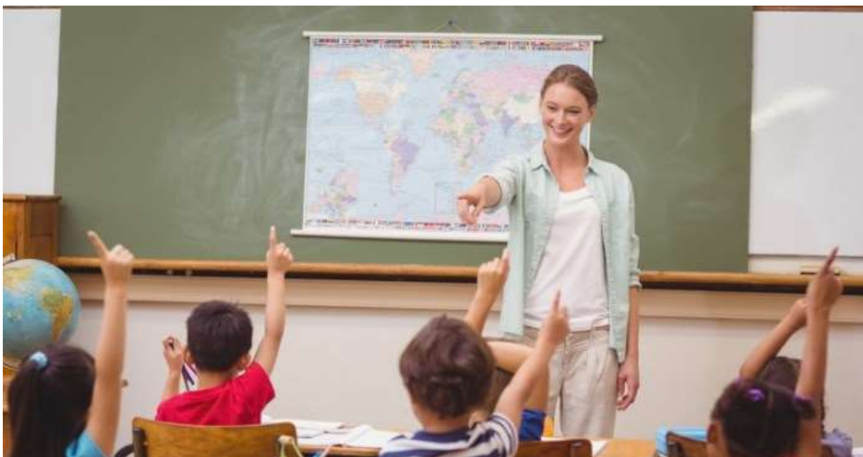
Lehrerin im Klassenzimmer, Illustration einer Arbeit über kritische Rassentheorie in K-12 Schulen · Bildquelle: ESB Professional / Shutterstock.com / spectator.org