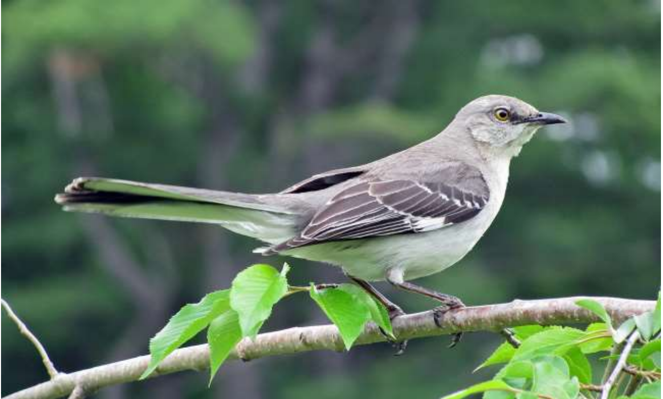
Amerikanische Spottdrossel (Mimus polyglottos)