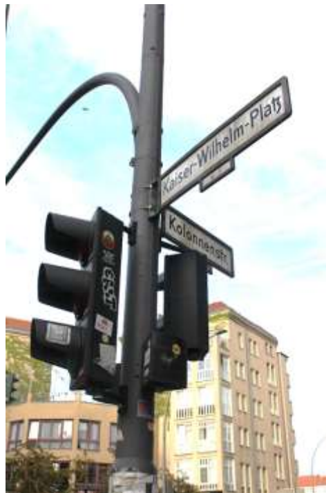
Kaiser-Wilhelm-Platz Ecke Kolonnenstraße, diese führt zum Flughafen Tempelhof