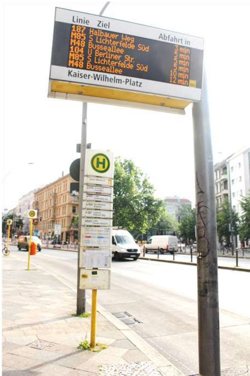
Kaiser-Wilhelm-Platz: mehr als fünf Buslinien fahren den Platz an...