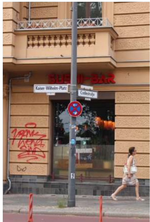
Kaiser-Wilhelm-Platz Ecke Cellestraße (im linken Bild die Hauptstraße links hinten)