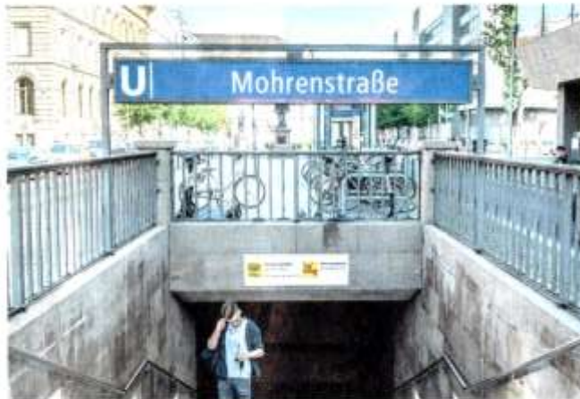
Die Bezirksverordnetenversammlung hat die Umbenennung 2020 beschlossen.

Andere Bezirksämter sind auf Anfrage zunächst ratlos, ob und welche