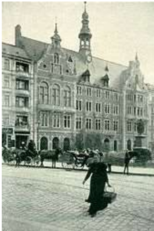
Historisches Foto des ehemaligen Schöneberger Rathauses am Kaiser-Wilhelm-Platz, um 1895

Auf der östlichen Seite des Kaiser-Wilhelm-Platzes befand sich seit 1874 das alte Schöneberger Rathaus . Nach Fertigstellung des neuen Rathaus Schöneberg am damaligen Rudolph-Wilde-Platz (dem späteren John-F.-Kennedy-Platz ) im Jahr 1914, wurde das Gebäude anderweitig genutzt und im Zweiten Weltkrieg zerstört.