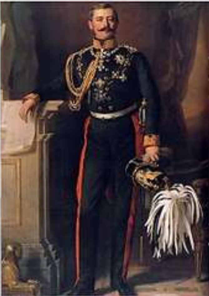
Karl Anton Fürst von Hohenzollern-Sigmaringen