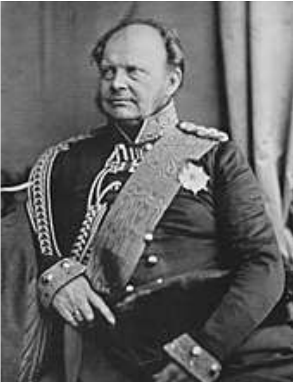
König Friedrich Wilhelm IV. , Bruder Wilhelms I.