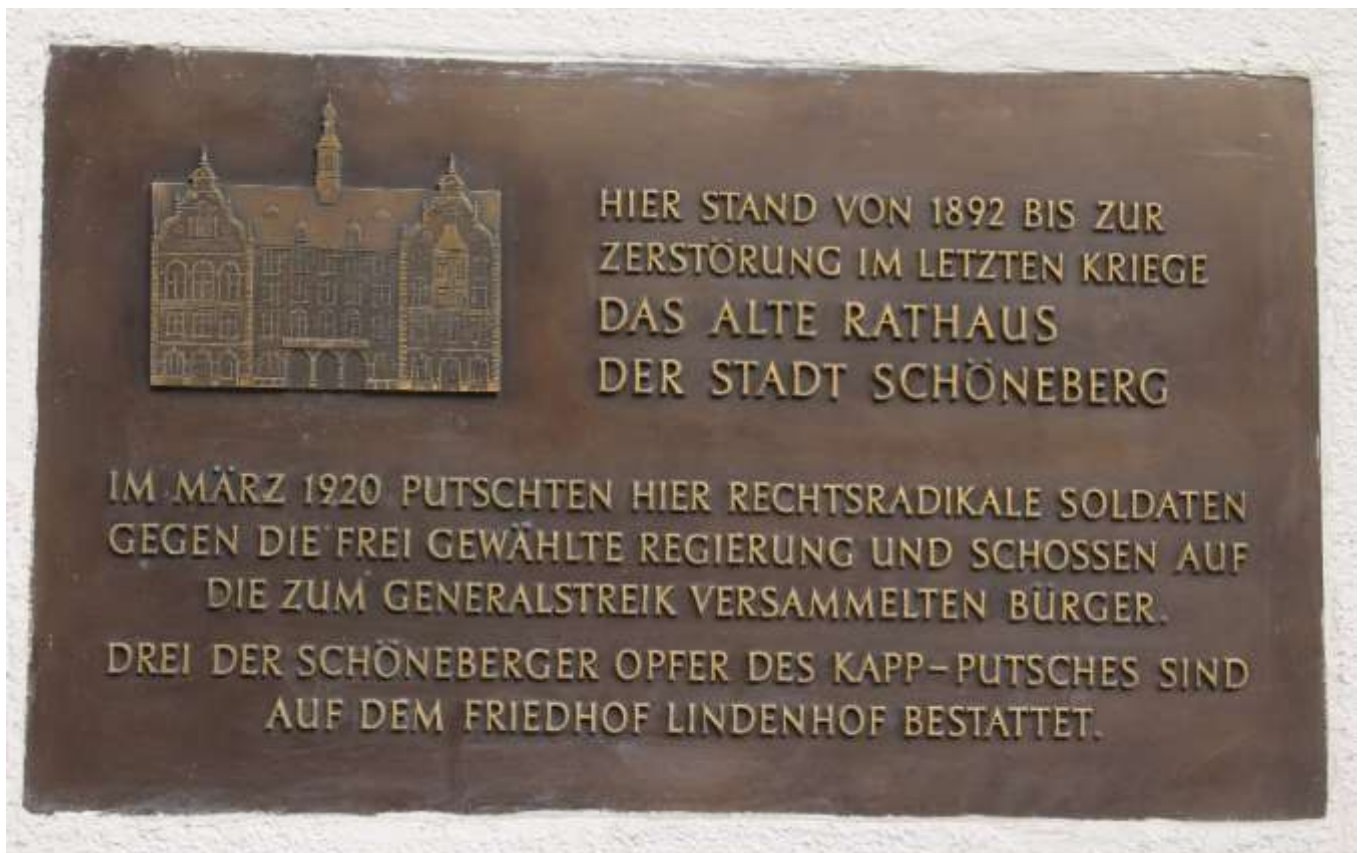
Gedenktafel an einem der wenigen Gebäude, die zum Kaiser-Wilhelm-Platz gehören