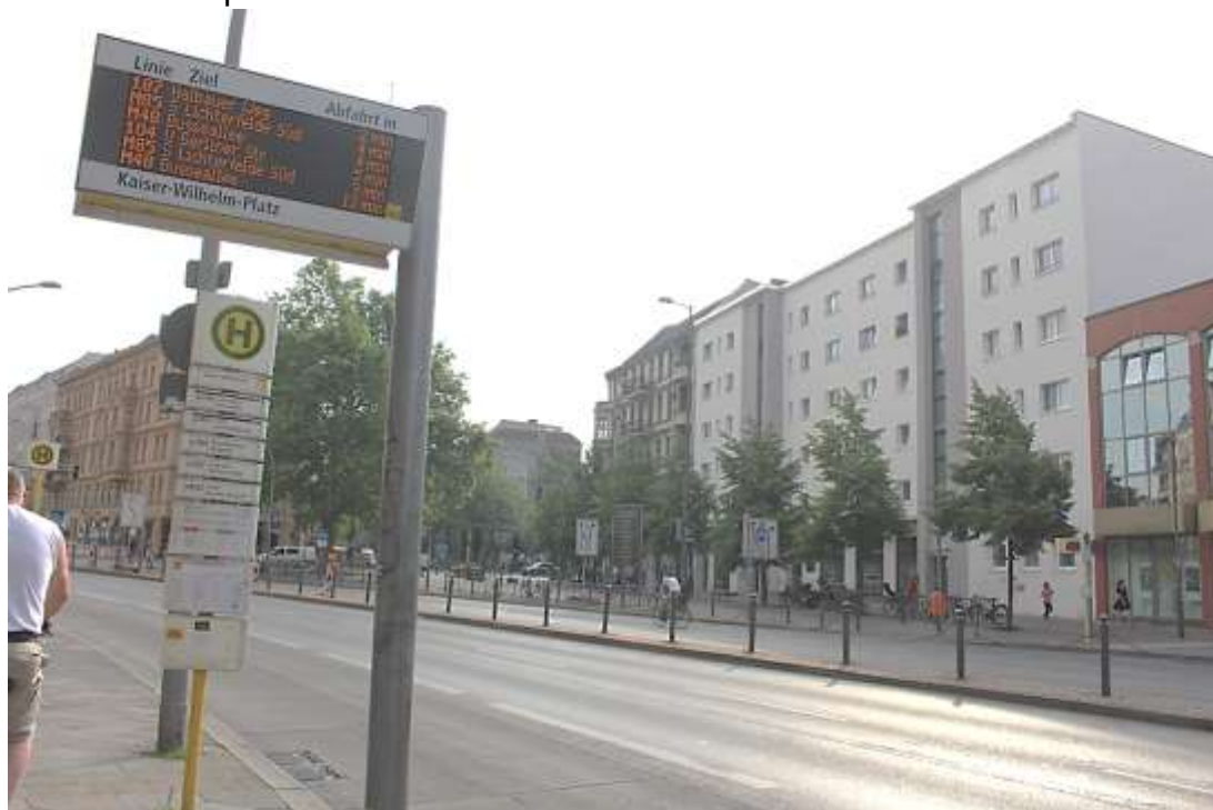
Blick von der Hauptstraße auf den Kaiser-Wilhelm-Platz

Blick über die Hauptstraße (Reichsstraße 1) auf Kaiser-Wilhelm-Platz mit der Einmündung der Kolonnenstraße: ein Dreieck mit wenigen Häusern, also wenige Mieter, wenig Gewerbe: geringer Betroffenenprotest?