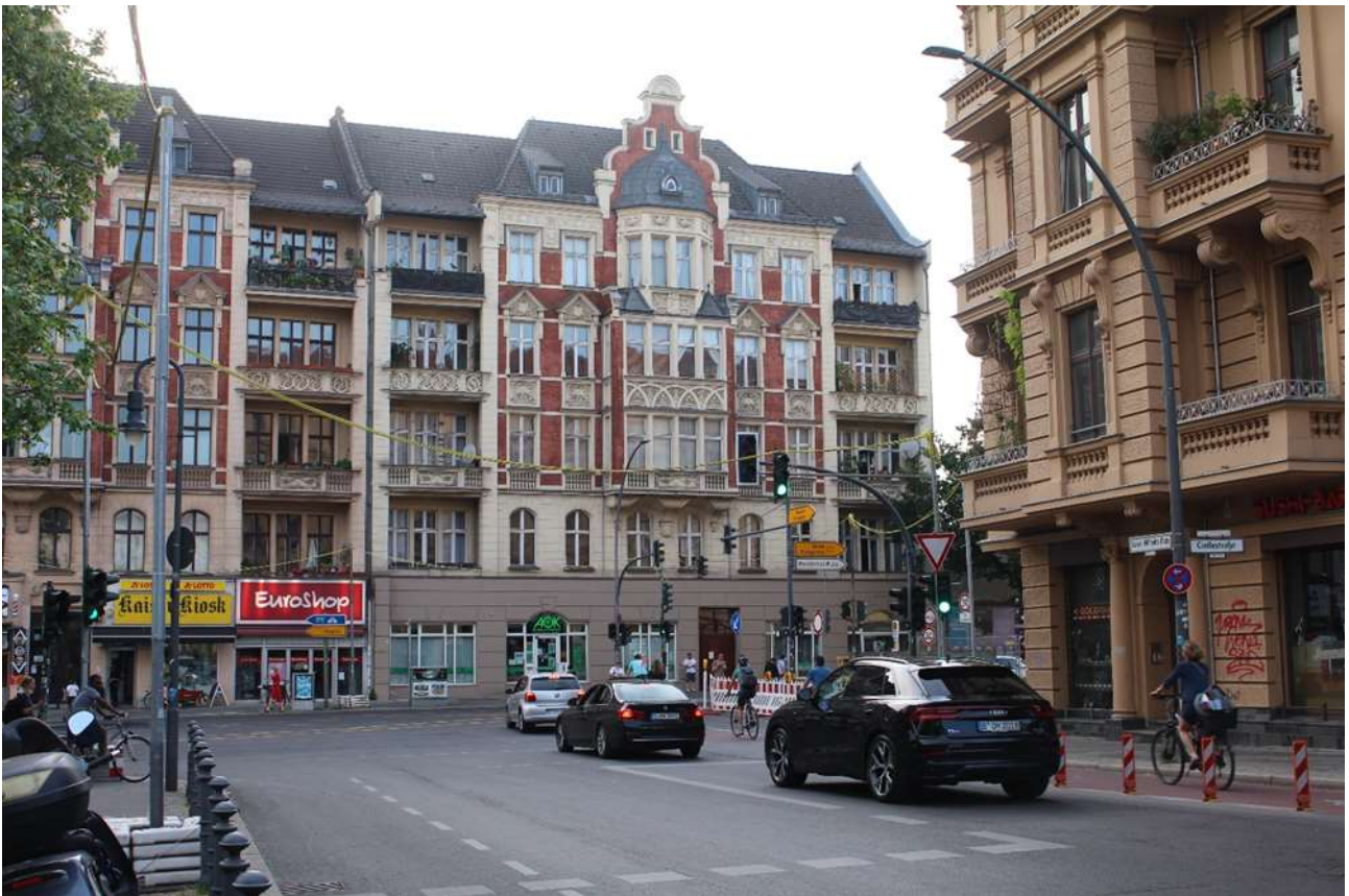
Blick durch die Kolonnenstraße zur Hauptstraße (Reichsstraße 1) (Standort von Foto 1)