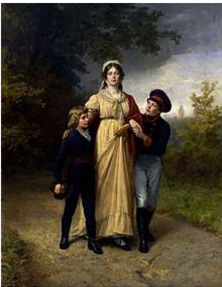
Königin Luise mit Prinz Wilhelm (links) und Kronprinz Friedrich Wilhelm (rechts), Gemälde von Carl Steffek , 1886