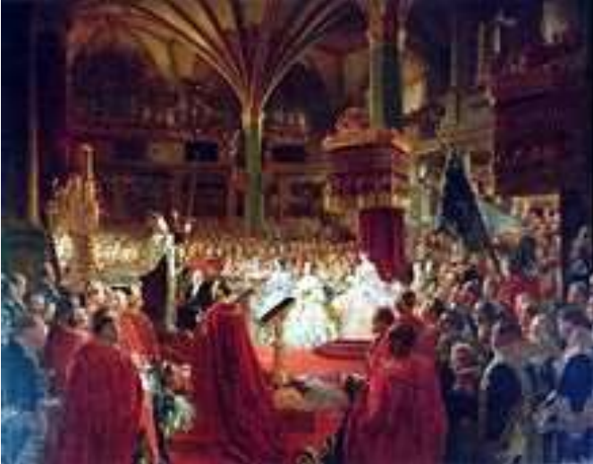
Krönung Wilhelms I. zum König in Königsberg, Gemälde von Adolph Menzel , 1861

Nach dem Tod seines Bruders Friedrich Wilhelm IV. am 2. Januar 1861 bestieg Wilhelm den preußischen Thron. Mit der von ihm selbst auf eigene Kosten veranstalteten Krönung meinte Wilhelm einen Kompromiss zwischen der nicht in der Verfassung vorgesehenen, aber von ihm gewünschten Erb huldigung , und der dort vorgeschriebenen Eidesleistung im Parlament gefunden zu haben. [10] Im Aufruf an mein Volk vom 8. Januar 1861 bekräftigte er seine Treue zum Eid auf die Verfassung, den er bereits 1858 als Prinzregent abgelegt hatte. Am 18. Oktober 1861 fand die prachtvolle Krönungsversammlung in Königsberg in der Schlosskirche statt.