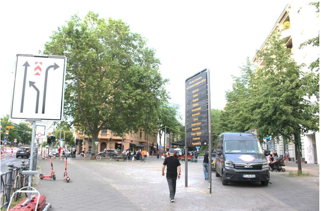
Kaiser-Wilhelm-Platz: Blick Richtung Crelle und Kolonnenstraße, linker Bildrand Hauptstraße, rechts die zum Platz gehörenden Gebäude, wo einst auch das Schöneberger Rathaus stand