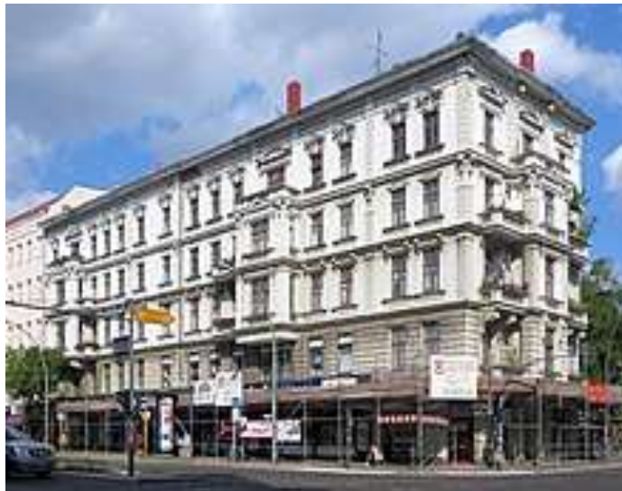
Kaiser-Wilhelm-Platz 5; Juli 2013