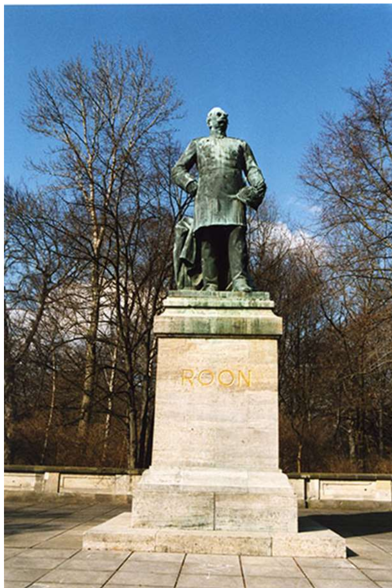
Aus: Berliner Woche (Steglitz-Dahlem) Roon-Denkmal am Großen Stern, v. 12.05.2021, S. 2 < https://bildhauerei-in-berlin.de/bildwerk/roon-denkmal/ >

Und es werden nicht nur alle nach Roon benannten Straßen betroffen sein, sondern auch die benachbarten Straßen die nach preußischen Militärs benannt sind. Und natürlich auch das Roon-Denkmal am Großen Stern.