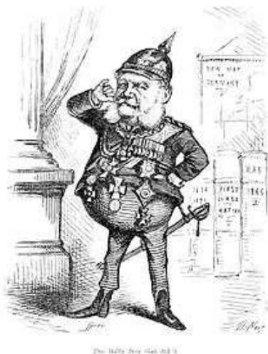
Karikatur Wilhelms I. von Thomas Nast