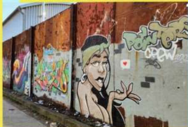
Graffiti Tour durch Schöneberg