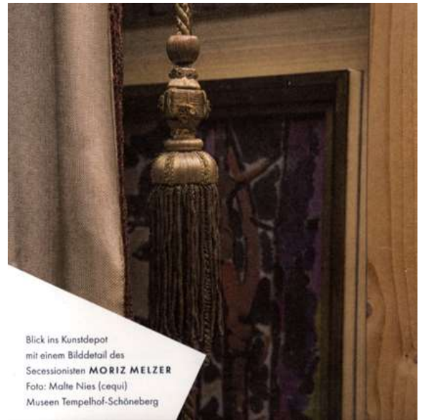
Blick ins Kunstdepot mit einem Bilddetail des Secessionisten MORIZ MELZER Foto: Malte Nies (cequi) Museen Tempelhof-Schöneberg