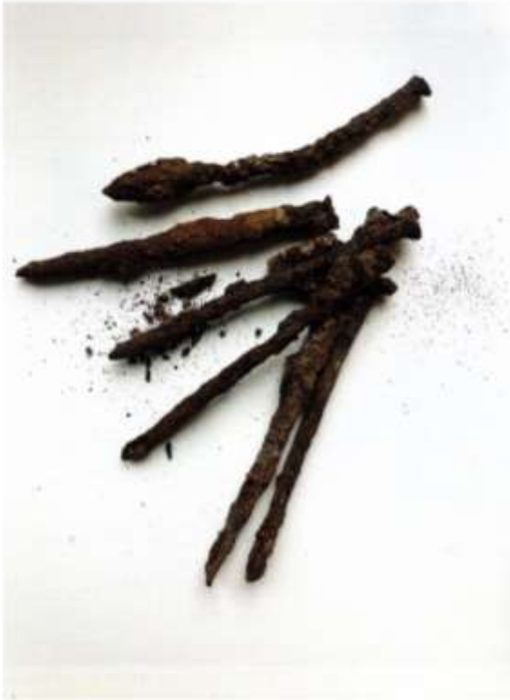
Verrostete Nägel vom Tempelhofer Feld, Foto: Sonya Schönberger, 2021