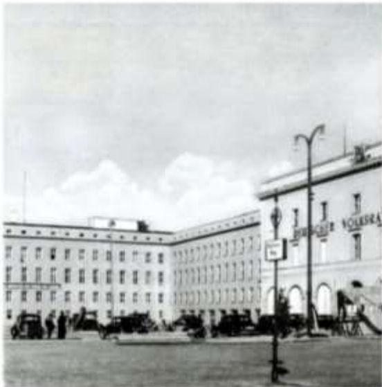
Thälmannplatz, Berlin, 1949 (Postkartendetail)

Ort: Informationsort Schwerbelastungskörper, General-Pape-Straße / Loewenhardtdamm, 12101 Berlin.