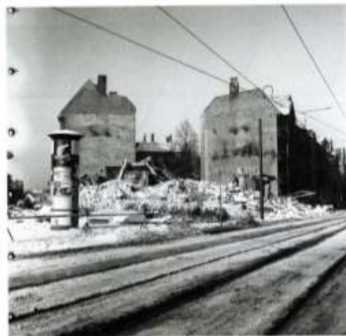
Trümmer auf dem Gelände der Thorwaldsenstraße 1-2, 10. Januar 1954

Zu entdecken auf www.museum-digital.de www.deutsche-digitale-bibliothek.de