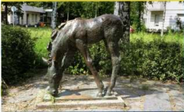
Widerstand und Kunst in Friedenau