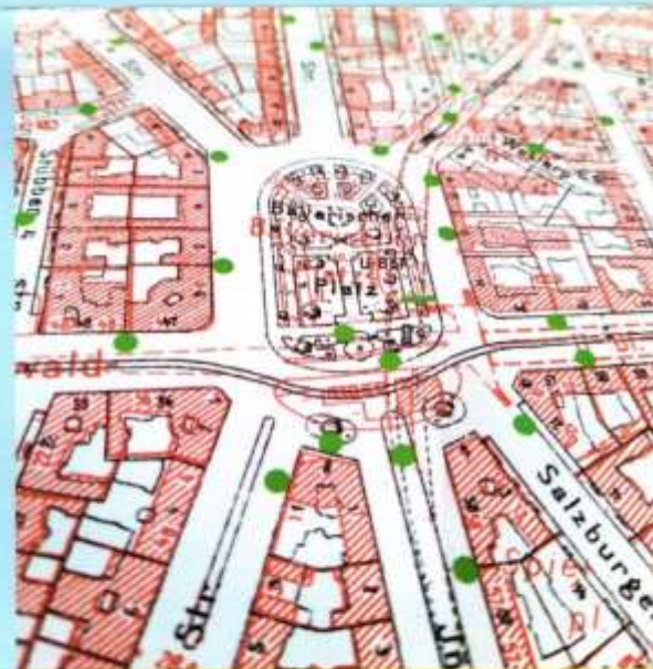
Jüdisches Leben im Bayerischen Viertel