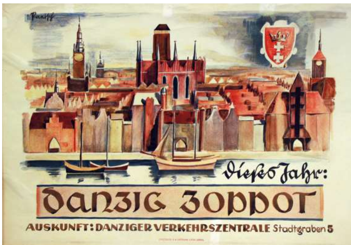
Plakat „Dieses Jahr Danzig Zoppot“. Farbdruck von Bruno Paetsch, Danzig o. J. (1930er Jahre).

Reisen – der Deutschen liebstes Hobby. Jahrzehntlang war der Tourismus zudem ein stetig wachsender Wirtschaftszweig – allein 2019 unternahmen die Deutschen insgesamt 70,1 Millionen Urlaubsreisen – bis die Corona-Pandemie dieser Entwicklung 2020 und 2021 erst langsam, dann umfassend ein Ende bereite. Aber das Reisen an sich war auch in vergangenen Zeiten durchaus schon ein Massenphänomen – wenn auch oft aus anderen Gründen als heute.