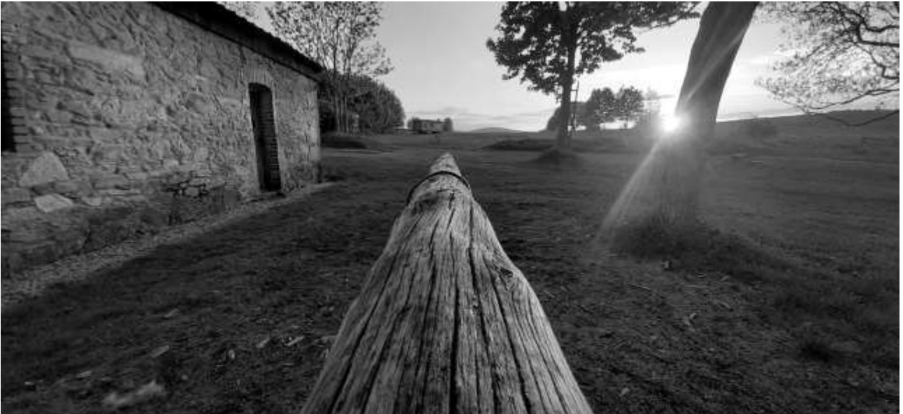
Kopaniec, Fotografie und © Jacek Jaśko