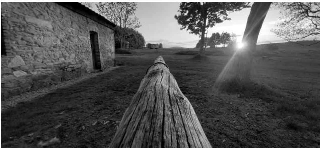
Kopaniec, Fotografie und © Jacek Jaśko