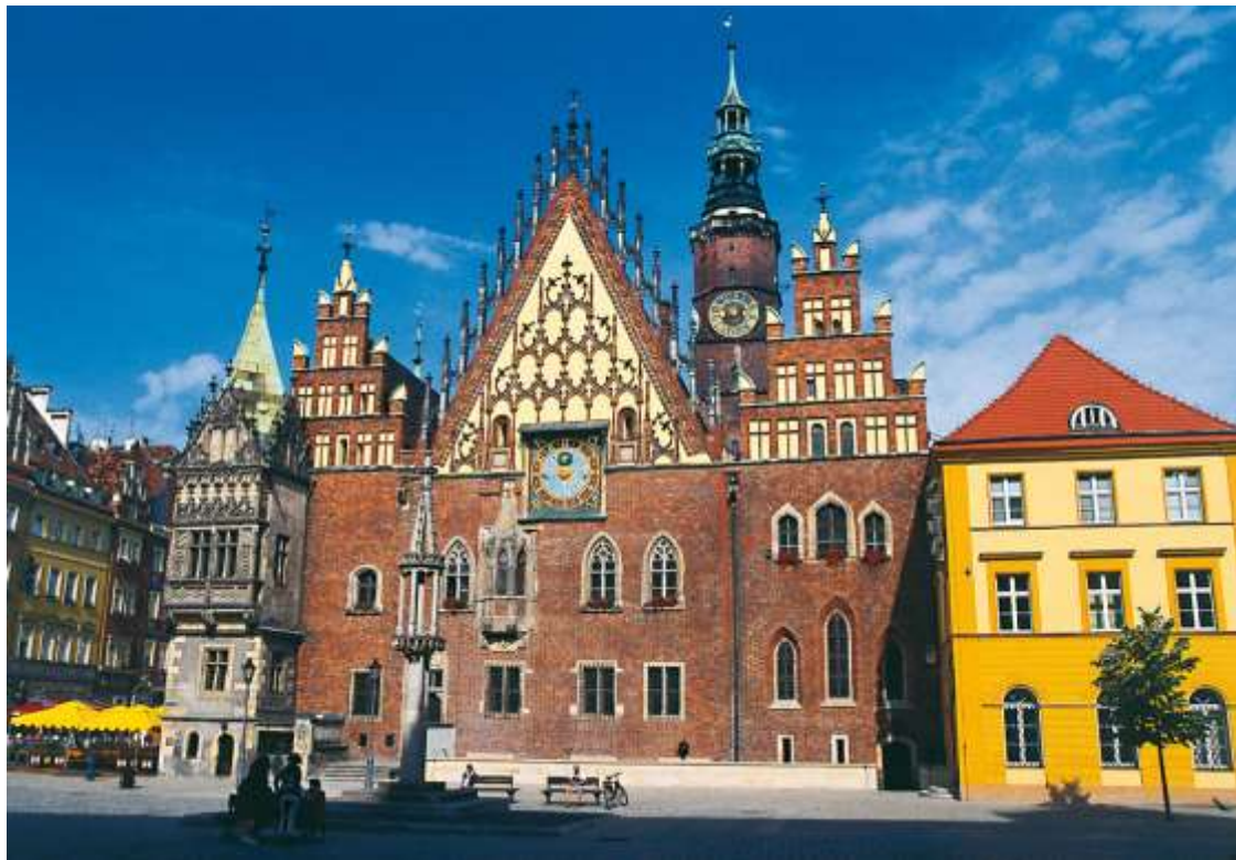
Das Rathaus in Breslau.

Das hintere Pommern bildet den Ausgangspunkt der Dia-Reportage des Berliner Journalisten und Fotografen Roland Marske. Die Reise führt von Stettin entlang der Ostsee an die untere Weichsel, in die ehemalige preußische Provinz Westpreußen mit seiner Hauptstadt, dem tausendjährigen Danzig.