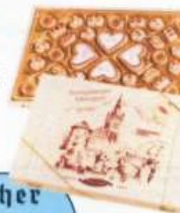
Eine Garnitur mit erlesenem Königsberger Marzipan der Fa. Schwermer in einer Holzschatulle

Deutschen Ostens in München geht diesen Frage nach. Sie befasst sich mit dem breiten Thema Essen und Trinken, Alltag, Identität und Integration. Es geht um die Lebenswirklichkeit der Flüchtlinge und Vertriebenen nach 1945 sowie der Aussiedler in späteren Jahren. Viele heute noch bekannte Firmen Gründungen der Nahrungs- und Genussmittelherstellung gehen auf Deutsche aus dem östlichen Europa zurück. Damit haben diese Unternehmen wesentlichen Anteil am wirtschaftlichen Aufbruch Deutschlands nach dem Zweiten Weltkrieg und darüber hinaus. Ein genauer Blick in die Regale der Supermärkte zeigt, dass heute noch viele „deutsche Spuren“ in den Auslagen zu finden sind. Präsentiert werden Familienrezepte, typische Gerichte, selbst gebaute Möbel, mitgebrachte Küchengeräte und vieles mehr.