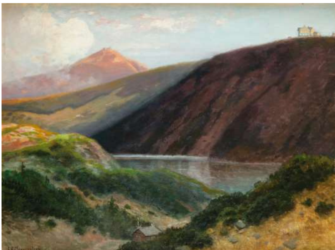
Carl Ernst Morgenstern (1847–1928): Der große Teich im Riesengebirge, um 1920, © Foto: SMG