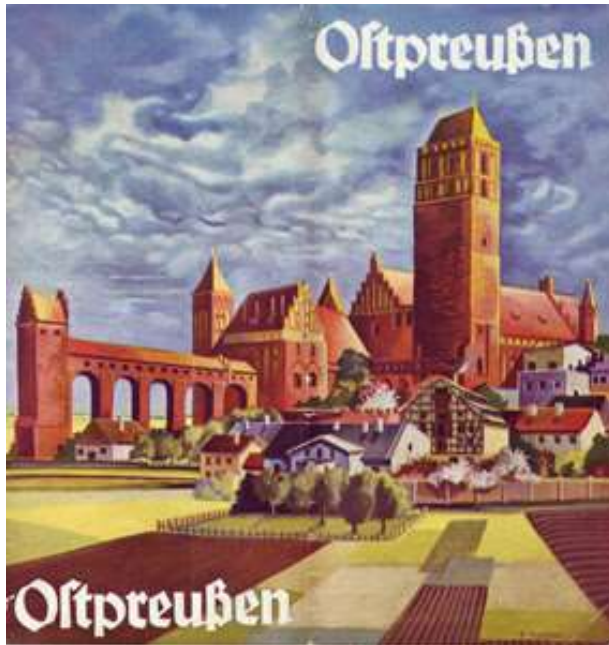
Reiseprospekt Ostpreußen.

Erst im ausgehenden 18. Jahrhundert begann man, andere Regionen und weiter entfernt liegende Orte wegen ihrer Geschichte, Bauwerke, Bibliotheken usw. zu besuchen. Diesen „Gelehrten-Reisen“ gesellten sich im 19. Jahrhundert Erholungsreisen hinzu, die zunehmend auch nach Ostpreußen führten. Der Erste Weltkrieg bildete eine Zäsur, doch in den 1920er und 1930er Jahren entwickelte sich der Tourismus zu einer wichtigen Einnahmequelle im geographisch abgetrennten und v.a. landwirtschaftlich geprägten Ostpreußen.