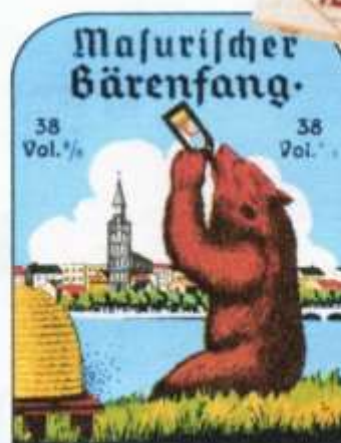
„Bärenfang“ – ostpreußischer Honiglikör