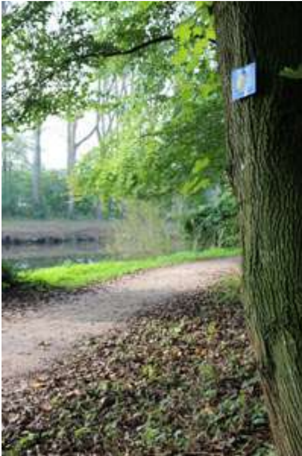
Pilgerweg in Warendorf.

Die Archäologin Ulrike Steinkrüger führt das Publikum auf historischen Wegen in eine ganz spezielle Art des Reisens ein: das Pilgern. Am Beispiel der Wege, die mittelalterliche Jakobspilger*innen nach Santiago de Compostela durch Westfalen genutzt haben, kommen auch zahlreiche Spuren zutage, die die Pilgernden damals hinterlassen haben. Wie sahen solche Wege im Mittelalter eigentlich aus? Und wie können sie rekonstruiert werden? Innerhalb eines Projekts der Altertumskommission für Westfalen (LWL) hat Ulrike Steinkrüger dies jahrelang erforscht und für heutige Pilgernde wieder sichtbar gemacht. Auch Warendorf ist seit 2015 an das Netz der europäischen Jakobswege angeschlossen. Also machen auch Sie den Weg zu Ihrem Ziel und begeben Sie sich mit uns auf die Spuren mittelalterlicher Jakobspilger*innen durch Westfalen.