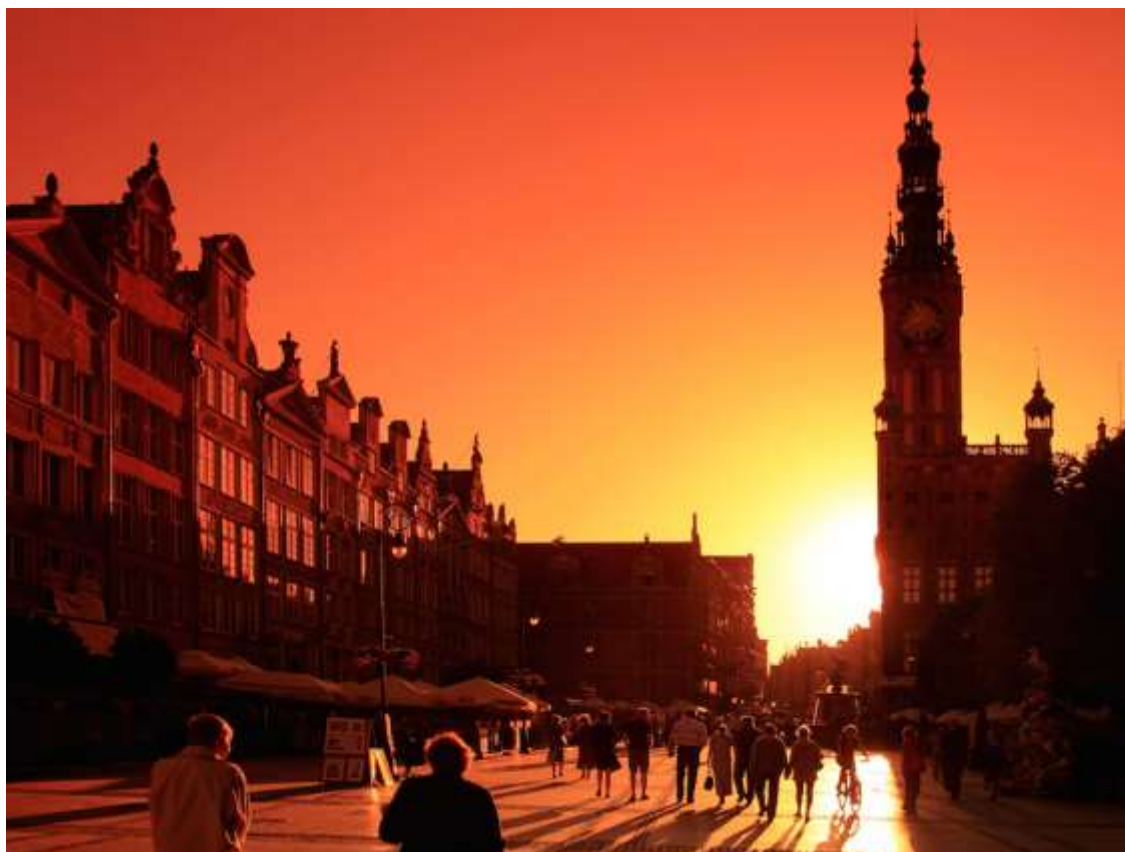
Der Lange Markt in Danzig.

Den Abschluss unserer kleinen Reihe bildet am 14. Oktober eine weitere Diareportage. Diesmal nehmen das Museum und das Kulturreferat für Westpreußen, Posener Land und Mittelpolen Sie mit auf eine Reise in eine andere ehemals preußische Provinz: Schlesien.