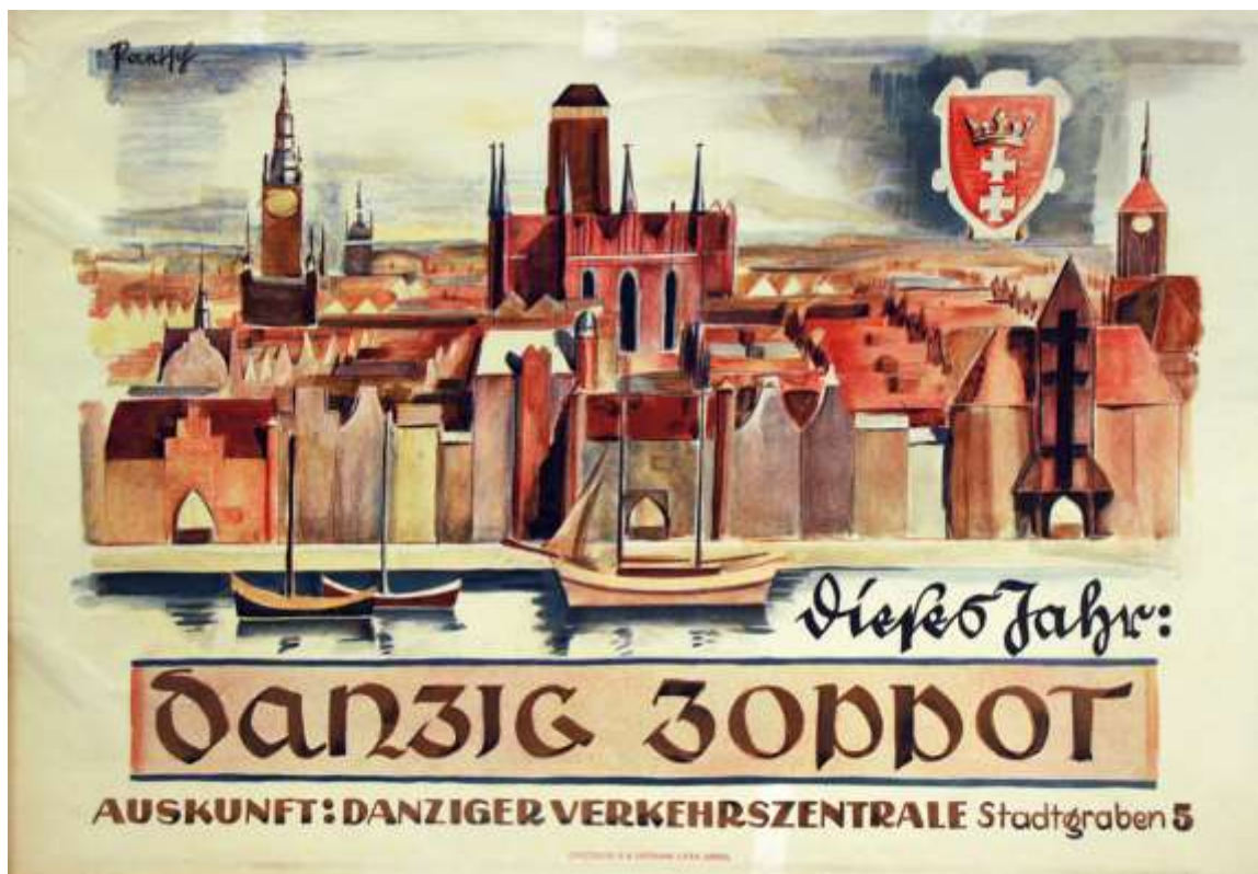
Plakat „Dieses Jahr Danzig Zoppot“. Farbdruck von Bruno Paetsch, Danzig o. J. (1930er Jahre).

Reisen – der Deutschen liebstes Hobby. Jahrzehntlang war der Tourismus zudem ein stetig wachsender Wirtschaftszweig – allein 2019 unternahmen die Deutschen insgesamt 70,1 Millionen Urlaubsreisen – bis die Corona-Pandemie dieser Entwicklung 2020 und 2021 erst langsam, dann umfassend ein Ende bereite. Aber das Reisen an sich war auch in vergangenen Zeiten durchaus schon ein Massenphänomen – wenn auch oft aus anderen Gründen als heute.