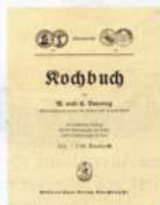
Nicht wegzudenken aus den Küchen in Ostpreußen: „Doennigs Kochbuch“. Hier die 25. Auflage (161.-170. Tausend), Königsberg 1938.

Wie viel von dieser kulinarischen Vielfalt, aber auch von Produkten und Firmen, hat nach Flucht und Vertreibung den Weg ins Deutschland der Nachkriegszeit gefunden? Was wird heute bei uns gekauft, gegessen, genutzt, ohne dass über Herkunft oder ursprüngliche Produktionsstätten nachgedacht wird? Wie viel hat das jeweilige kulinarische Erbe zum Erhalt der Identität der Deutschen aus dem Baltikum, aus Ost- und Westpreußen, Pommern, Russland, Schlesien, Böhmen, Mähren, der Slowakei, Ungarn, Jugoslawien oder Rumänien beigetragen?