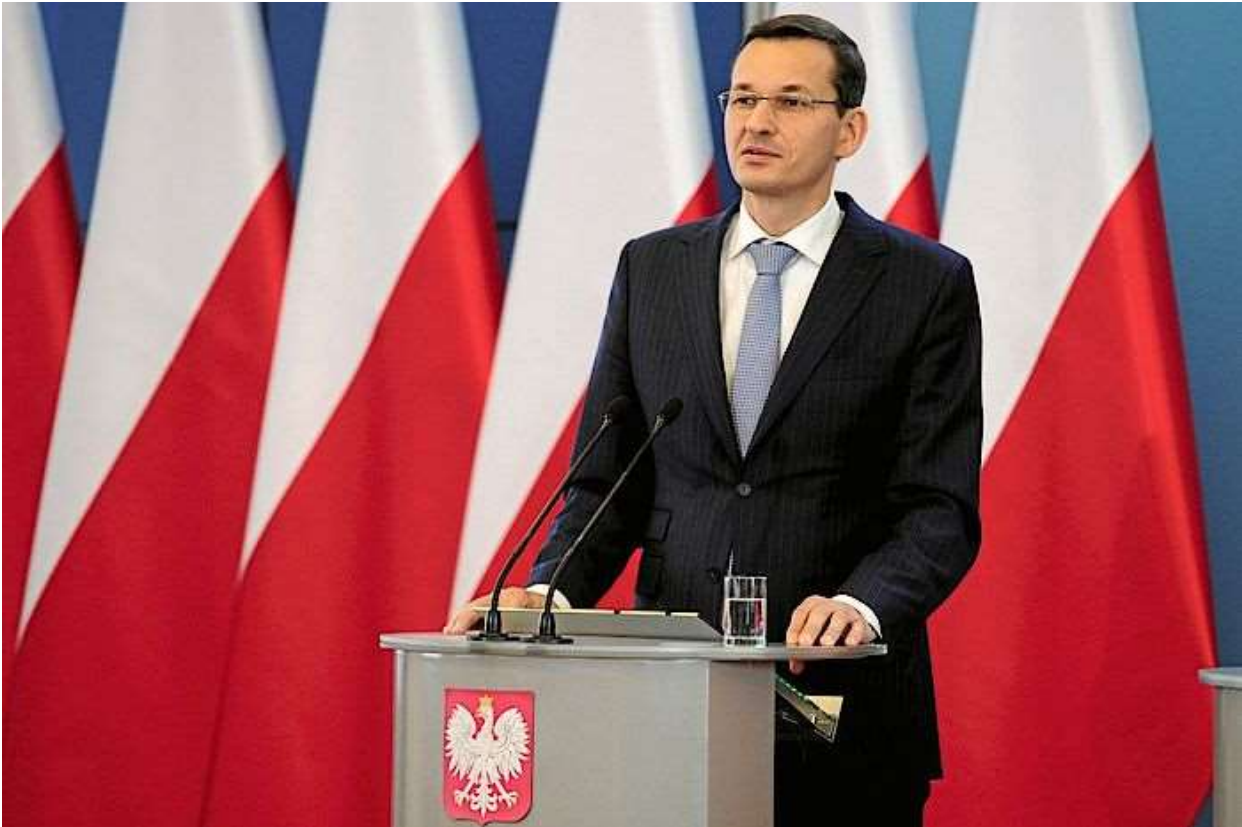
Mateusz Morawiecki

Die feindselige Reaktion auf die Rede des polnischen Ministerpräsidenten Mateusz Morawiecki im Europäischen Parlament zeigt, dass die EU nicht nachgeben wird und weiterhin versuchen wird, die Kompetenzen ihrer Institutionen zu erweitern.