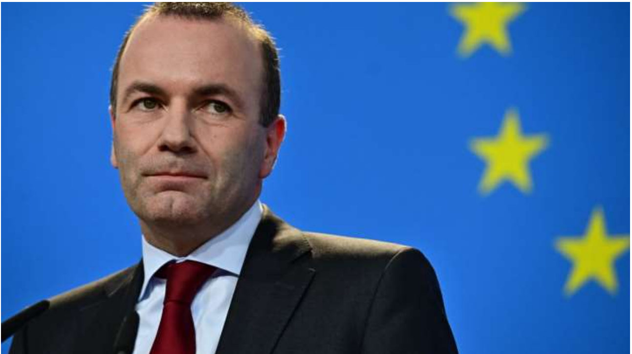
Manfred Weber

Wenn in Berlin in naher Zukunft eine sozialdemokratisch geführte Regierung gebildet wird, was zunehmend erwartet wird, wird Ljubljana (Laibach) die westlichste europäische Hauptstadt der Mitte-Rechts-Bewegung werden, was für die Parteienfamilie, die die EU-Politik jahrzehntelang dominiert hat, sehr unangenehm ist.