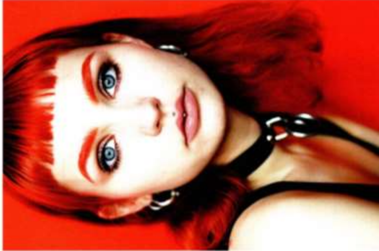
© Birgit Kleber, »Modern Queens #10«, 2019