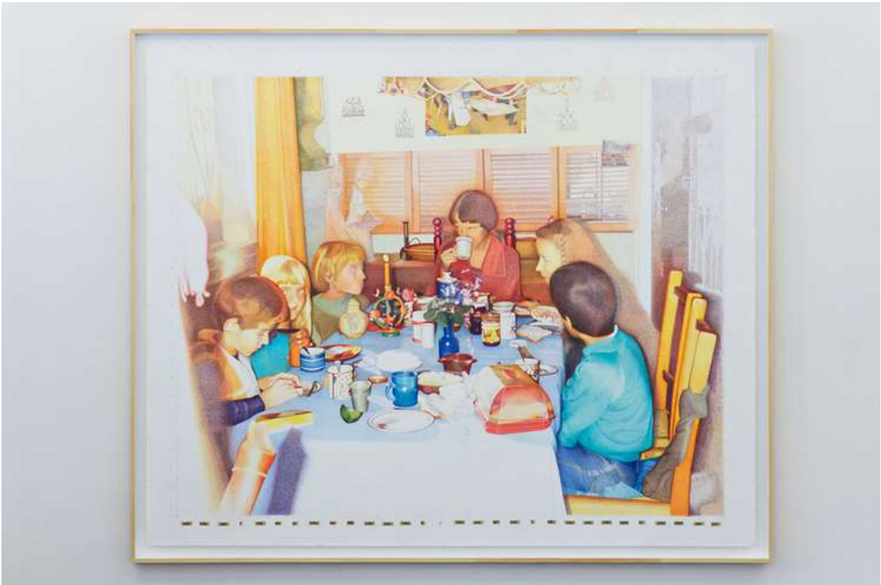
Olaf Kühnemann, Grid References, 2020/2021, Buntstiftzeichnung auf Papier