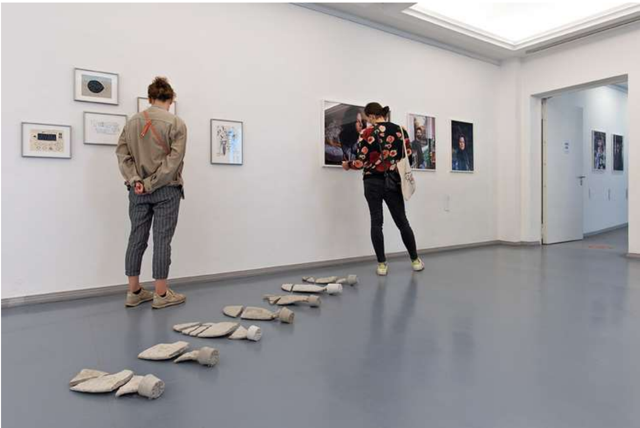
Michal Fuchs, Disillusionment, 2021, Betonskulpturen auf dem Boden, Ausstellungsansicht