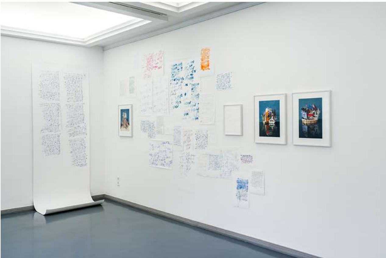
Atalya Laufer, Ohne Titel (aus der Serie Yaakov), 2021, Wandinstallation mit von ihr gezeichneten Texten des Bildhauers Ben Yaakov, (Archiv Kibbuz Hazorea, Israel) und Fotografien aus einer gleichnamigen Fotografieserie von 2015