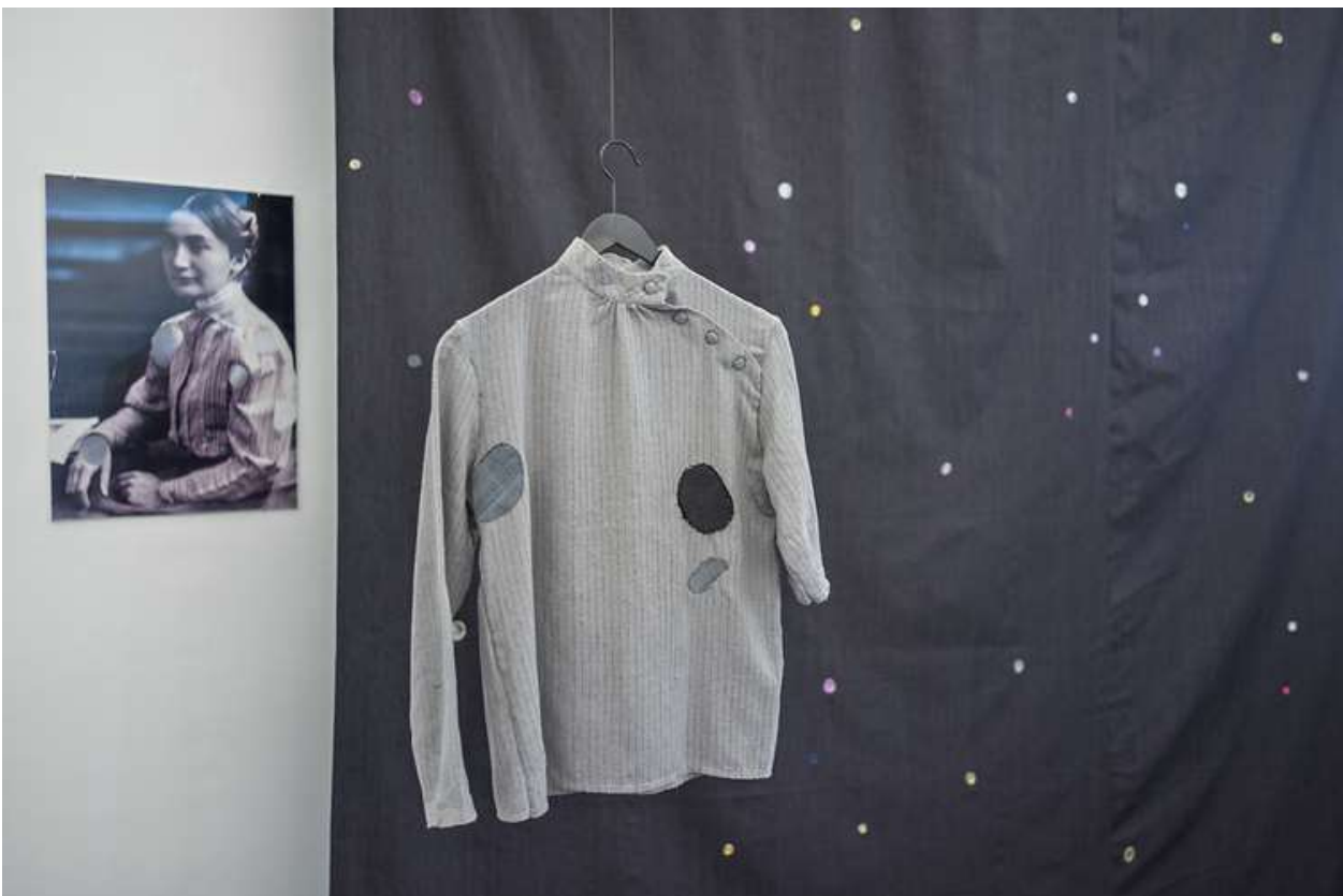
Birgit Szepanski, Mirroring City, 2021, Installation (Ausschnitt) aus einem Vorhang (mit Kaugummi), Collage mit einer Archivfotografie Helene Nathans (Museum Neukölln), textilen Objekten und Künstlerheften des Helene Nathan Verlages