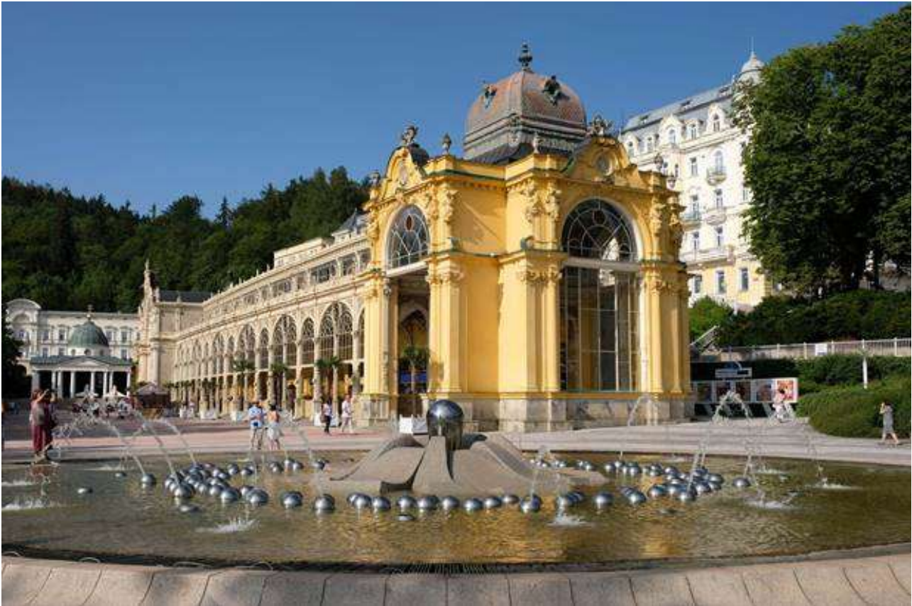
Foto: Bäderarchitektur in Marienbad, 2020.

Sonntag, 29. November 2021, bis 03. Dezember 2021, Bad Kissingen