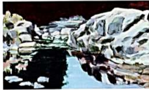
Ausstellung Palmenschatten im Haus am Kleistpark, siehe S. 49 © Silke Leverkus, Ciuffenna, 2018

Telefon 030-90 277 4527 projekt@wirwarennachbarn.de www.wirwarennachbarn.de