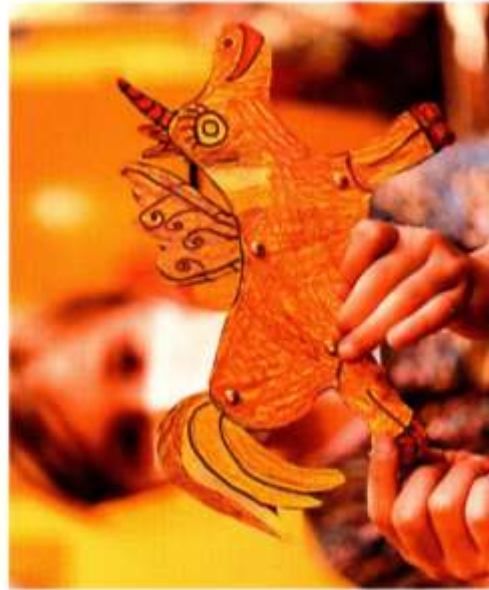
Offenes Atelier im Jugend Museum, Foto: Peter Rofle

Offenes Atelier Basteln, spielen, werken für die ganze Familie