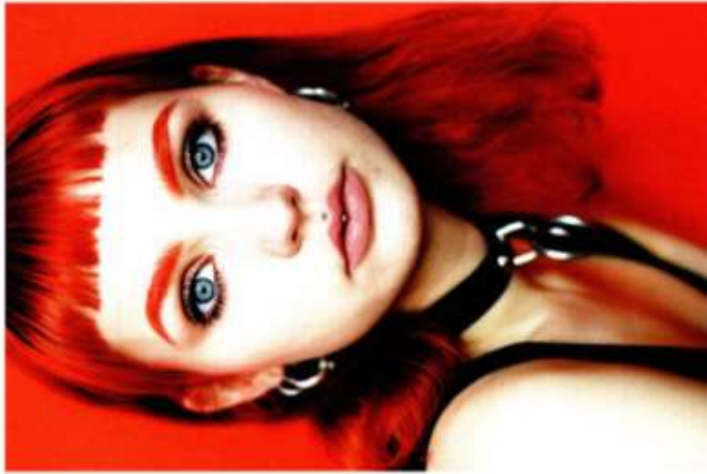
© Birgit Kleber, »Modern Queens #10«, 2019