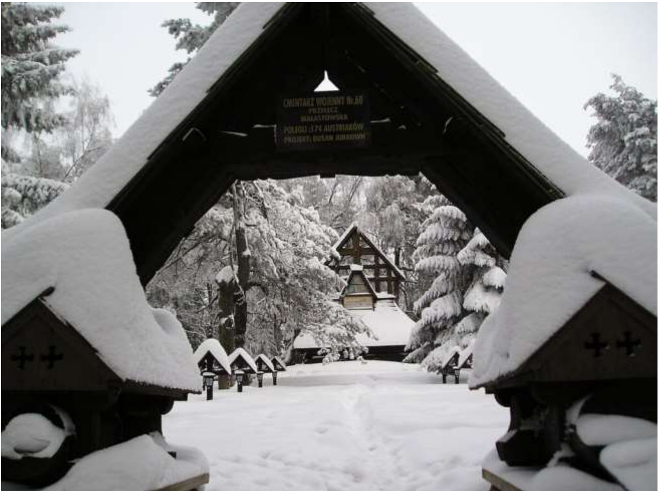
Kriegerfriedhof Magura.