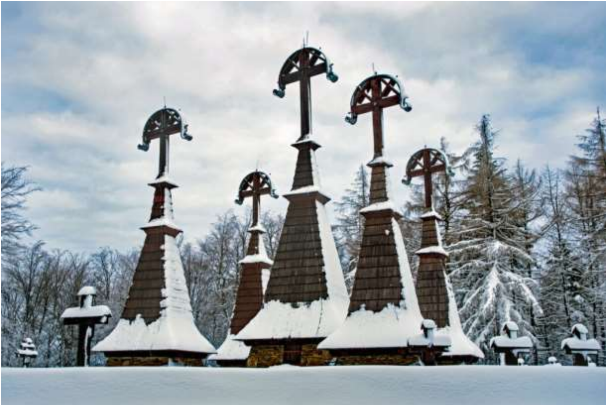
Kriegerfriedhof Rotunda.

Einzigartig und in ihrer Form von gesamteuropäisch kunsthistorischer Bedeutung sind dabei die 32 von Architekt Dušan Jurkovič gestalteten Friedhöfe in den Niederen Beskiden, in den Ausläufern des Karpatenbogens. Der Slowake Dušan Samo Jurkovič (1868-1947), eine der führenden Architektenpersönlichkeiten der Tschechoslowakei in der ersten Hälfte des 20. Jh., erhielt seine technische Grundausbildung an der Wiener Staatsgewerbeschule und erwarb sich danach autodidaktisch die Befähigung für die Ausübung des Architektenberufes. Nach der Jahrhundertwende reüssierte er erstmals vor einer breiten Öffentlichkeit durch seine Bauten in Mähren, wie zum Beispiel mit seinem eigenen Wohnhaus in Brünn oder mit den außergewöhnlichen Hotel- und Bäderbauten in Bad Luhačovice, welche vom Jugendstil und von der englischen Arts and Crafts -Bewegung in Verbindung mit Elementen aus der Volksarchitektur geprägt sind. Um 1910 beschäftigte er sich mit Restaurierungen und Schloßumbauten wie Nove Mesto nad Metuji.